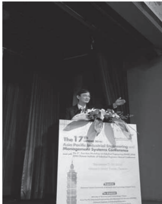
図2 APIEMS 会長挨拶

本年度は2016年12月7日（水）から10日（土）の4日間にわたり、The 17 th Asia Pacific Industrial En-