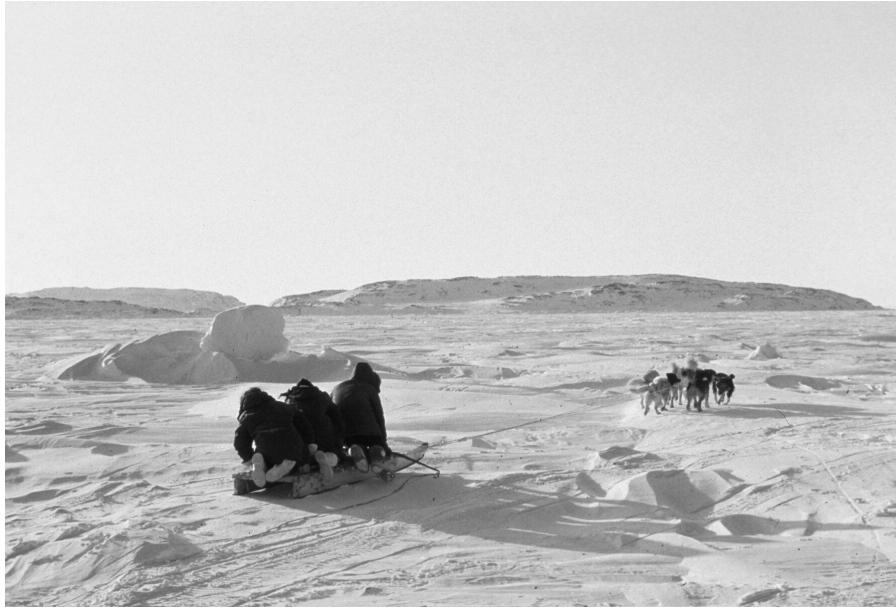
写真3 海氷上を走る犬ぞり（カナダ・ヌナブト準州、1997年4月）

リブーを槍で刺した。向う岸では女性と子供が岸に上がろうとするカリブーを水に追い返して、ハンターと勢子の間を泳ぎ回るカリブーを仕留めた。