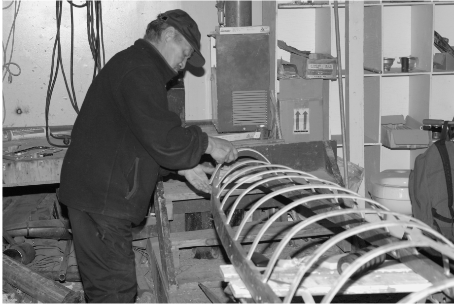
写真4 カヤックの骨組みを作る（カナダ・ヌナブト準州、1997年4月、筆者撮影）

ーモビルにとって代わられる結果となった。アラスカのイヌイトの社会では、皮張りのウミアックを模してキャンバスを張ったものが今でも使われているが、カナダとグリーンランドでは昔ながらのウミアックは姿を消している。アリュートの社会でもイヌイトの社会でもカヤックは猟に使われることもなく、スポーツ用に限られている。