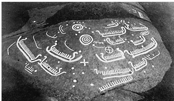
写真1 ロシアのオネガ湖の岩絵 (Johnstone 1980 : 32 による)