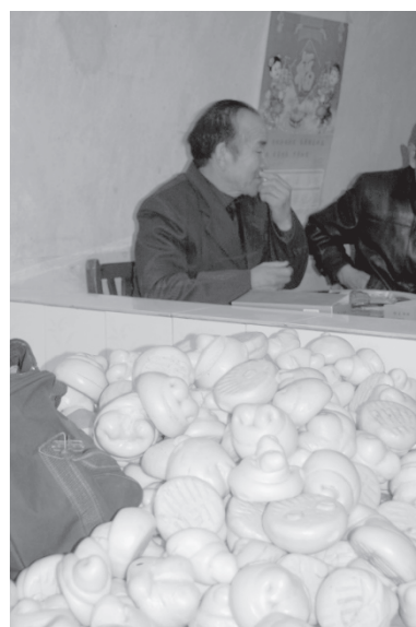
写真6 婚礼における「餛飩饅」(礼饅頭)