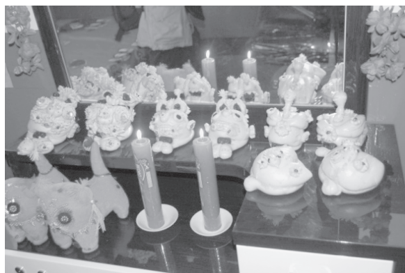
写真8 新婚の部屋における花饅頭