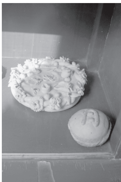
写真 14 党家村「民俗館」：中秋節の「月餅饅頭」