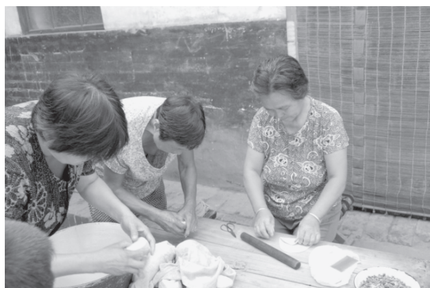
写真10 農婦たちが一緒に花饅頭をつくる