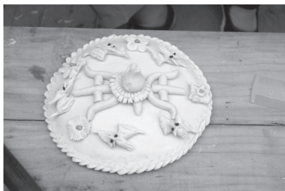
写真12 「寿盤」の花饅頭（生地）