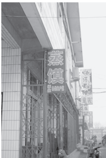
写真9 西庄镇の花饅頭店