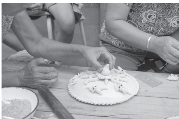
写真11 完成した「寿盤」の形