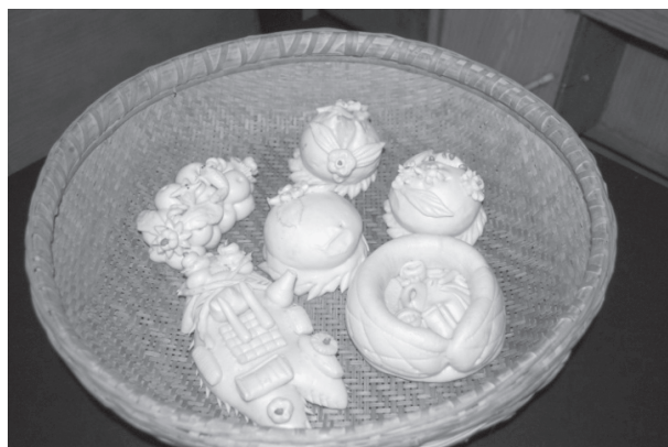
写真 13 蒸したばかりの七夕花饅頭：果物饅頭（桃・ぶどう）、硯饅頭、裁縫道具饅頭