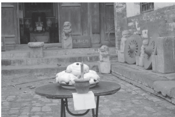
写真3 農家における神祭り、祖先祭りの供物台