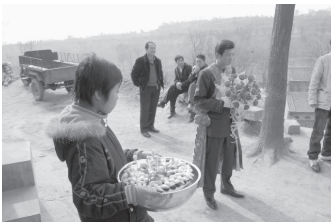
写真5 嫁迎えに来た新郎と「棗蒸」(の容器)をもつ少女