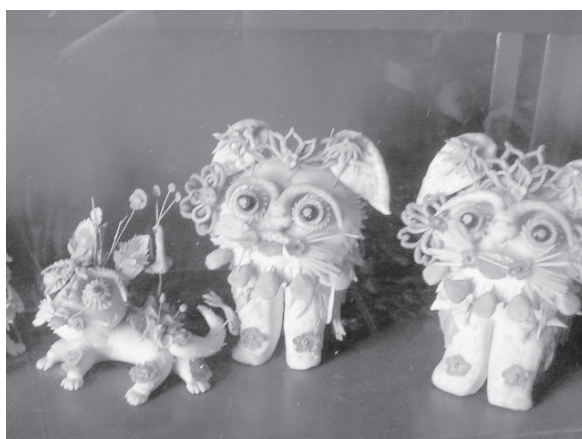
写真4 党家村「民俗館」に陳列された一組の「虎饅頭」