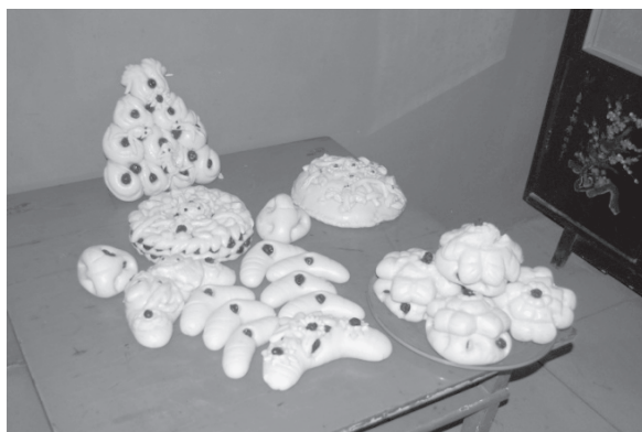
写真2 大晦日の夜、蒸したばかりの花饅頭と礼饅頭