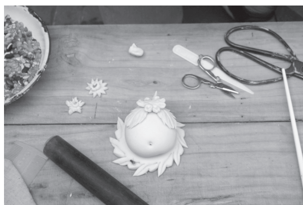
写真 15 花饅頭をつくる道具