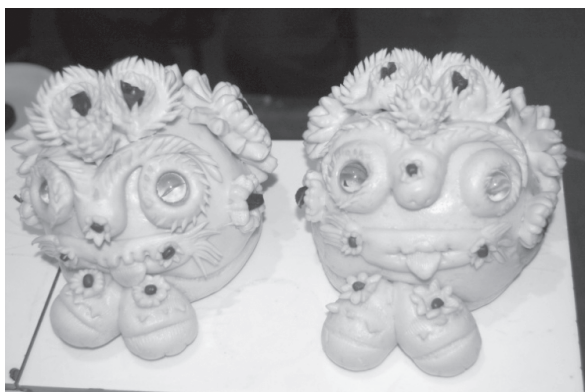
写真7 婚礼における新郎が贈る一組の「虎餛飩」