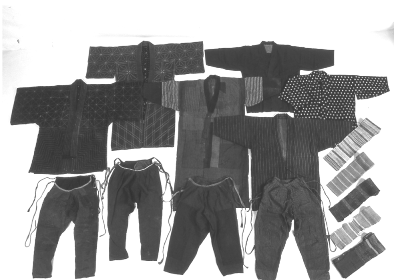
写真2 作業着コレクション