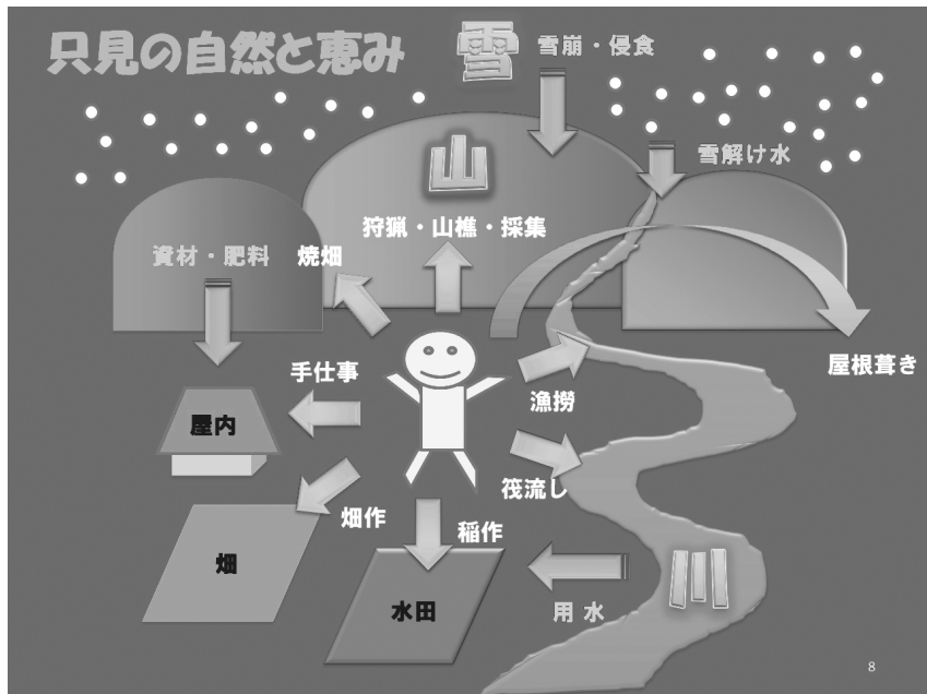
図1 会津只見の生産用具（自然と民具の模式図、人と山・川・雪）

また神奈川大学の佐野賢治教授のゼミでは、只見町大倉地区の学術民俗調査を大学院生を中心にして行い、学術調査報告書『大倉の民俗』を平成20年に刊行している。只見町と神奈川大学との交流は、民具を介して年を経るごとに深まっていった。5年間にわたる神奈川大学21世紀COEプログラムの研究作業では、非文字資料としての民具研究という事業で、只見の