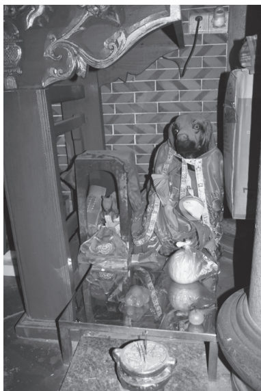
写真4 玉犬（泉州・奉聖宮、2010年）