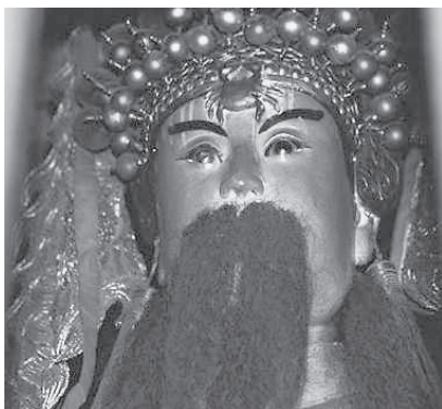
写真8 田公元帥の神像（寿寧県坑底橋・元帥宮、2000年）。

田都元帥（相公爺）の神像は蟹を額に描くものがあり（写真8）、口の両脇に蟹が吹く泡が描かれ