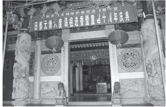
写真3 泉州・奉聖宮（2012年）

「放兵」「収兵」には演劇が行われ、3日・5日・7日続く時もある。正月15日と8月16日は祭日として演劇が演じられる。新作公演の場合は、最初に田都元帥、つまり相公爺の前で演じてみせることが約束事である。2011年には再建十周年記念に因み大祭を10月14日に「謁祖進香」として行った (32) 。廟内の中央正面の祭壇には、大元帥と二元帥の二人を祀り、総称して「相公爺」という。廟の壁には琵琶や胡琴を持つ音曲の演奏者の姿が四人ほど描かれて「戲神」としての性格