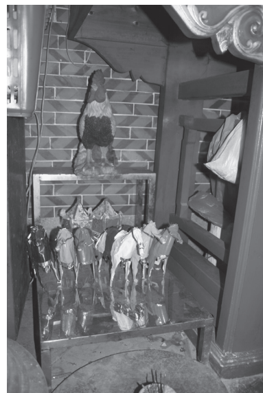
写真5 金鶏（泉州・奉聖宮、2010年）