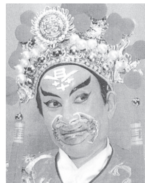
図10 田都元帥を演じる役者（『中国戯曲志 福建巻』1993）