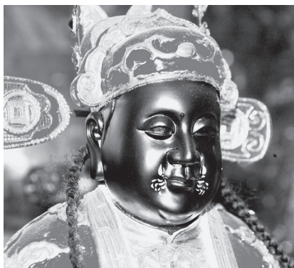
写真9 田都元帥の神像（台湾彰化県鹿港市・玉渠宮、2012年）。