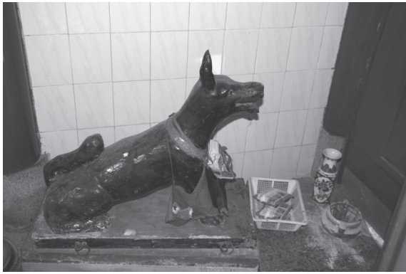
写真6 玉犬（泉州・桂香宮、2010年）

を表すが、相公爺は冠を被った武将の姿に整えられている。祭壇の下、向かって右側に「玉犬」の像（写真4）、左側には「金鶏」と「七兵馬」の像（写真5）が置かれていた。玉犬は狗舎爺、金鶏は烏官爺ともいい6月6日が祭日である。双方とも相公爺の従神とされ、かつて雷海青が従者を玉犬と金鶏に変えて右と左の袖の中に入れて舞ったという伝承に因む〔黄錫鈞 1988〕。田都元帥と犬との関連は深く、莆田の忠門鎮の木偶班は白い犬を左足で踏みしめ