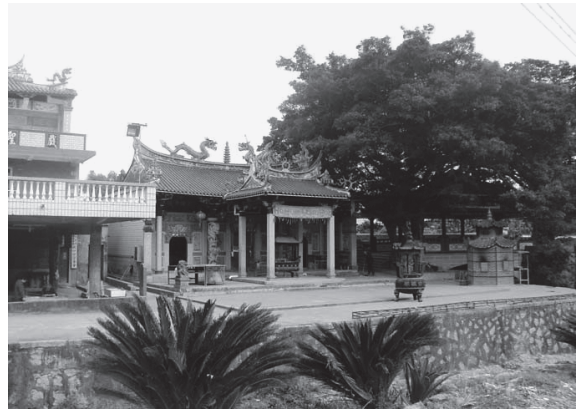
写真1 南安県・坑口宮

蘇員外は怒って子供を田圃に捨てたが、三日たっても子供は死なない。よく見ると蟹が泡を吹いて養っていた。畚（ショオ）族の農民が親切にも子供を養うこととし、名前を雷海青とした。平時は父母の仕事を手伝い勉強もよくして大きくなったが、十八歳まで話をするができなかった。音律をよく知り、琵琶の演奏が巧みであった。開元2年（714）に玄宗皇帝の宮中に楽工として選ばれて入った。皇帝が月宮に遊んだ時、楽譜を詠みこなして口を開いた。その時の「霓裳羽衣曲」の演奏を玄宗が気に入り、御酒を三杯賜った