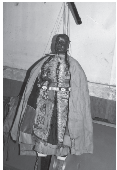
写真7 人形の相公爺 (泉州・東嶽廟、2010年)