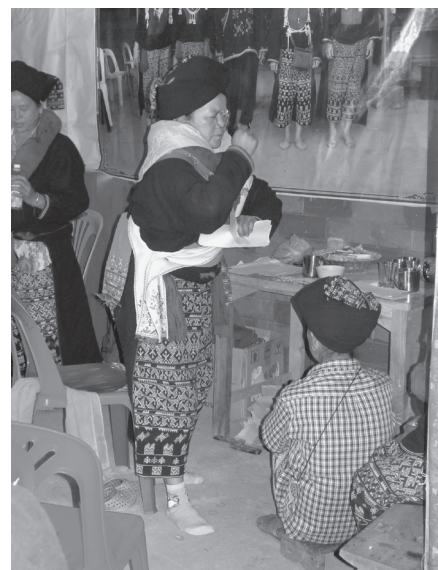
写真4 治療儀礼を行う女性シャマン (HCP村、2012年1月) 無言で〈釵〉を振って儀礼を司祭している。

降神した女性シャマンによる儀礼の多くは治療儀礼と厄払い儀礼、強化儀礼である。すなわち表1で言えばC列の儀礼に相当する。治療儀礼と厄払い儀礼は、歌を唱わないシャマン祭司のタイプの場合、表1C列の儀礼を、歌唱司祭の形式で執り行う。歌を唱うシャマンの場合は、治療儀礼では患部に触れたり、マッサージしたりして、直接的に患部に働きかける所作で儀礼を進行することが多い。聖水などを与えることもある。厄払い儀礼では、歌を唱って儀