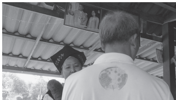
写真6 背中に捺された〈老君印〉（HCP村、2013年2月）