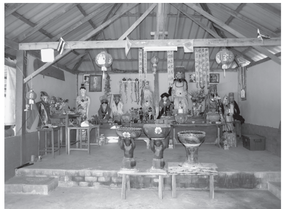
写真1 HCP村の新しい〈廟〉の祭神（2012年1月）

このような〈廟〉を作る動きは、他のユーミエン村落でも見られる。ナーン（Nan）県ムアン郡NG村では「ユーミエン文化センター」を2008年に起工して2010年2月14日（陰暦正月初一日）に完成し、この日に最初の祭祀を行った。落成直後には神像や礼拝対象となるものはまだなかった。やむなく、「盤皇聖帝 衙前 投進」と書いた紅紙を貼り、祭祀を行った。その後、ナーン市街にある漢人の廟の写真とHCL村の〈廟〉に祀ってある神像（写真2）の写真とを合成加工した画像をプリントした幕を正面に掲げた。この画像幕はそのままであるが、2013年に「盤皇靈位」