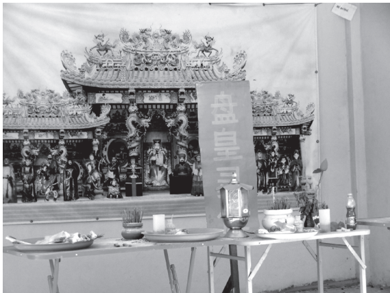
写真3 NG 村の〈廟〉内部（2013年6月） 「盤皇靈位」の牌が祀ってある

（実物は中国簡体字）とプリントした小幕を画像幕の前に置いた（写真3）。いわば「位牌」である。この〈廟〉では、シャマン儀礼でなく、男性祭司による伝統的な形式の儀礼を陰暦正月初一日、七月十四日に行っている。また、陰暦の毎月初一日、十五日に村人が随意に焼香しているが、特に儀礼は行っていない。