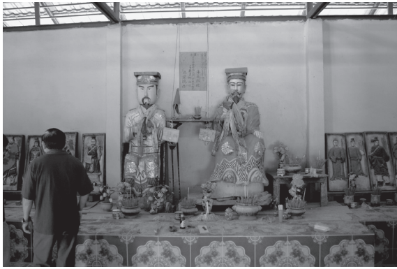
写真2 HCL 村の〈廟〉の祭神（2013年5月）