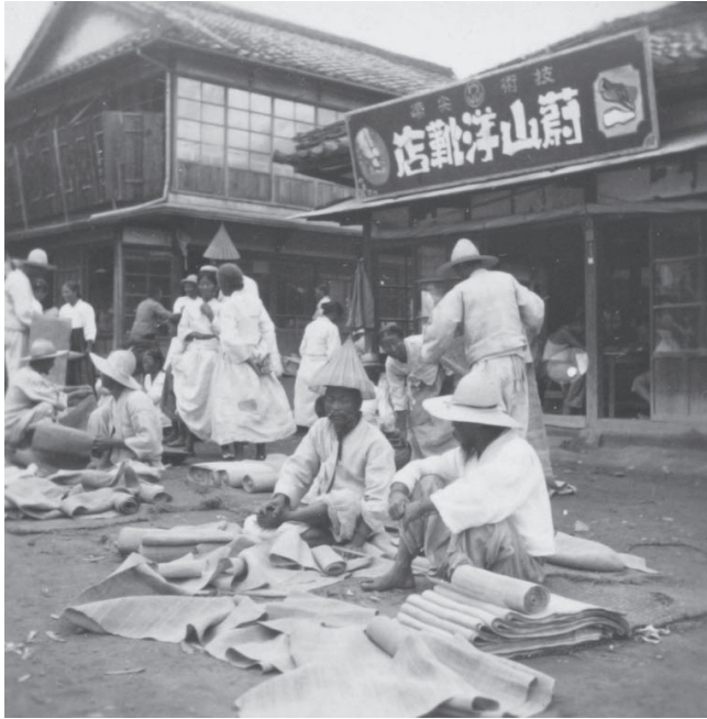
写真2 神奈川大学日本常民文化研究所蔵のフィルム写真「山崎洋靴店前で布を売る人々」(宮本馨太郎 撮影、目録番号：ア-61-14)