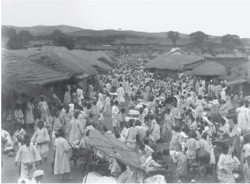
写真1 ソウル大学博物館所蔵のガラス乾板写真（中心奥が太和楼）

乾板は、京城帝大の日本人研究者による1930年代の民俗調査の遺物」という話が、日韓を中心として研究者たちのあいだに広まったのだ。一度にみつかったからといって、これらの写真群がすべて同じ時期に同じ人物によって同じ目的で撮られたとは限らない。このため、上記の2つの発見をもって、このように断定することは出来ない。にもかかわらず、この話は研究者たちのネットワークのなかで真実味を帯びて広まり、太和楼が写るあの数枚の写真も「京城帝大の日本人研究者による1930年代の民俗調査の遺物」ということになってしまった (2) 。