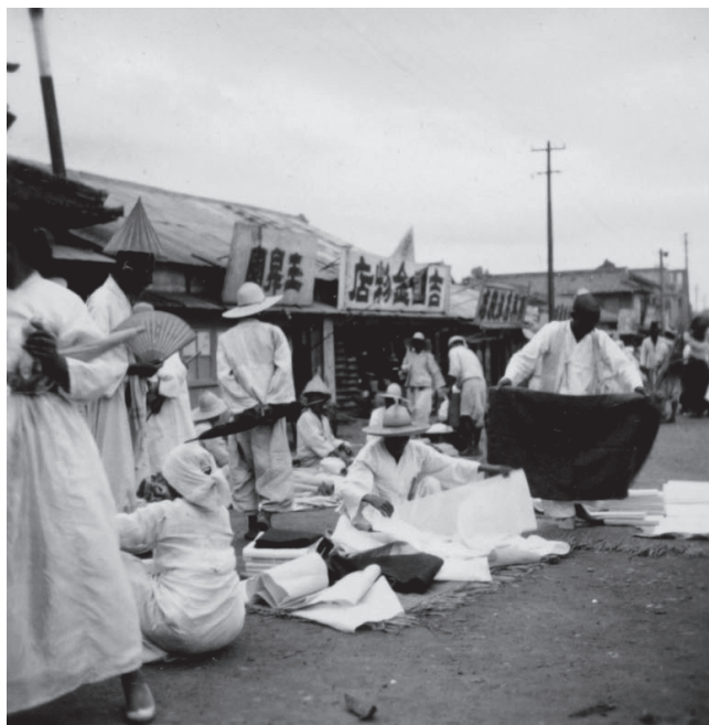
写真3 神奈川大学日本常民文化研究所蔵のフィルム写真「街中で布を売る人々」(宮本馨太郎 撮影、目録番号：ア-61-015)

る (e.g. 写真2; 写真3)。ここで、ために写真1と、写真2および写真3をとり、両者を見比べていただきたい。どうだろうか。上記の新説が依拠するような特定の建造物に関する専門的な史料探求や歴史知識を経なくとも、これらが同じ時期に同じ街で撮られた写真だとは、誰にとっても考えられないのではないだろうか。