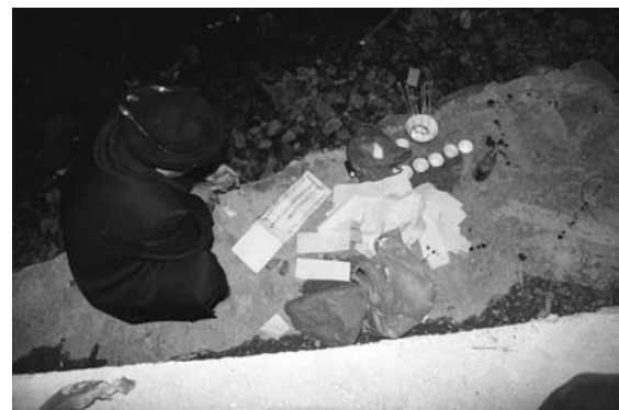
写真16 手訣を行う