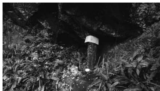
写真14 白公廟

楽隊、香籠、龍船が現れ橋を渡りきると、今朝六郎廟において行われた龍の舞が行われる。うねる様な動作、体を上下に動かす動作などを舞い終えると香籠は川辺の炎の中に投げ込まれた(写真15)。それに続いて、龍船と法明が積んでいた紙銭の上へ儀