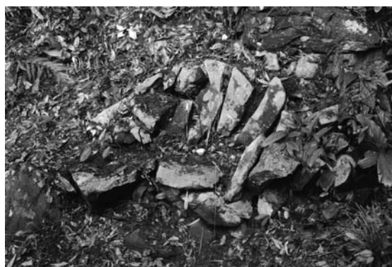
写真3 靈官廟