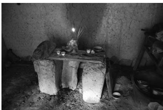
写真2 廟内の六郎神