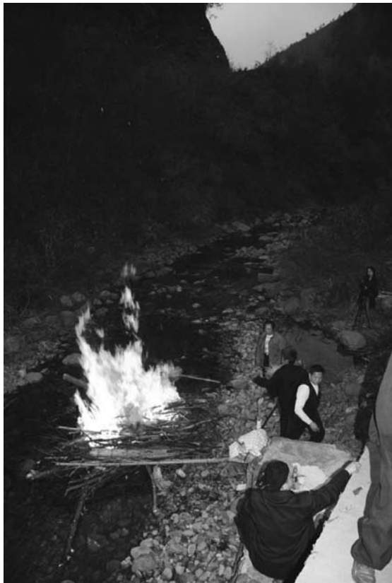
写真15 火に投じられる香籠

で儀礼を行う形となる。法明は唱えごとを行い、法旗は杯への献酒の後、積んである紙銭に火を点ける。法明は唱えごとを行うのみだが、法旗は唱えごとをしつつ紙銭を加えて燃やす。以上で送船儀礼は終了した。