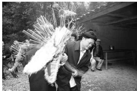
写真10 香龍の舞