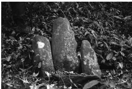
写真13 招壇土地廟

り立った崖の下に出来た空間に楕円形の石が立てられたものである。村人は先ほど招壇土地廟にて捧げられた鶏を持ち、その血を白公廟の石にも撒き、紙銭を貼り付けた。