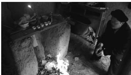
写真12 「供奉六郎」儀礼

土地廟は、六郎廟の東側にある細い山道を降りた、すぐ側に位置する。余談だが、この道を下っていくと沢に着き、飲食の水はこの沢から調達されている。土地廟があるという場所には竹や草が生い茂っているため、一見して土地廟を確認できない様なあり様であった。案内役が鉋で生い茂る竹や草を切り、道を開くと、そこには確かに倒木が確認でき、更に草を切ると、三つの