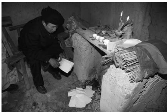
写真9 廟内での儀礼

西の端の家へ到着すると、玄関より入って正面に位置する祖先壇へ各人が行進をしながら礼を行う。ここで香龍の頭部が祖先壇の前へ来ると持ち手は、頭部に挿されている線香1本を香炉に挿し礼拝をするが、その後ろへ続いている持ち手は礼のみ行う。この屋内での楽隊と香龍の行進の際、龍船は庭先に置かれており、屋内に入る事はない。行進が終わると、家の主人が庁堂の正面の三廟大王を祀るとされる壁中央部下、祖先の祭壇の下と庭先の龍船の側で紙銭を燃やしていた (2) 。盤法旗がこの家へ到着すると、右手に剣、左手に名簿と紙銭を持ちながら玄関先で唱えごとを始めた。しばらく唱えごとをした後卜具による占いをを行い、紙銭を小さく丸める。そして丸め終わってしまうと自らの体の周りを時計回りに3回回し、2枚目の紙銭を丸め始める。この紙銭の1つは家人に渡され祖先の祭壇へ、もう1つは法旗の唱えごとと共に龍船へと入れられる。家人に渡された1つは家族全員の魂魄を祖先が守ってくれるように祖先の祭壇に置かれる。もう1つは火災が起らないように、また病気がはやらないようにと龍船に入れられる。法旗が玄関先で儀礼を行っている際、この家の家人は穀物の殻と木炭を入れた包みを龍船に入れ、さ