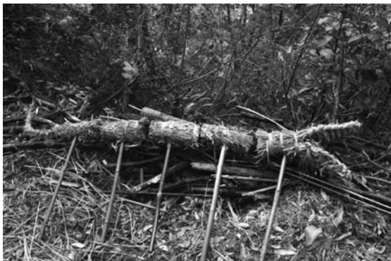
写真6 香龍

香龍の胴体部分の製作は、比較的簡単で藁の中に草を詰め、円柱状にしたものに柄を付け竹ヒゴで固定する。ただ、頭部から尾まで次第に細くなるように作られてい