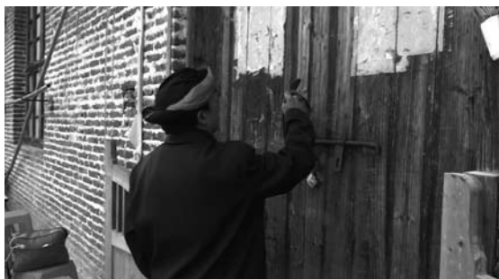
写真11 符(魁字)を描く

霊官廟は3個の楕円形の大きな石が縦に置かれて作られており、前に平らな石が置かれ祭壇として使われている。廟と名付け