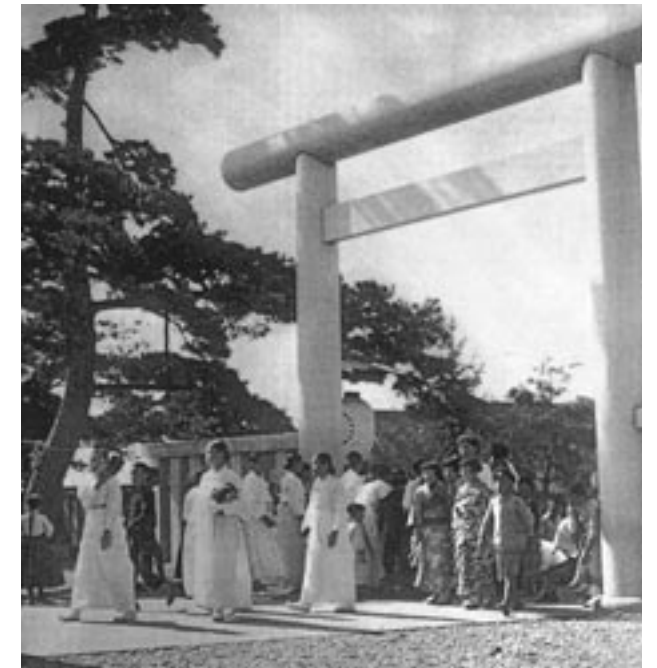
㉙ 官幣大社朝鮮神宮の参拝風景 (『民草競う』というキャプションが付けられ, 「朝鮮の人にも敬神の思想が普及されて, 拝殿に拍手を打って参拝する者が多くなった」と解説している。『同』130頁)