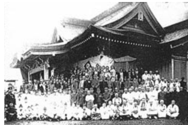
㉚ 旧樺太 真岡支庁下, 野田神社再建の年の祭典記念 (海外への移住者にとって, 神社は「内地」の人以上に重い意味を持っていた。『樺太野田町慕情』, 1977年10月, 佐藤彦雄編, 樺太野田小学校同窓会野田白樺会, 全国樺太連盟提供)