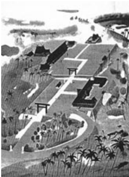
㉟ 旧南洋群島 コロール島（パラオ）に建てられた官幣大社南洋神社の鳥瞰図 (現在、この境内の大部分が個人の所有地になっており、私邸も建てられている。『官幣大社南洋神社御鎮座祭記念写真帖』、1941年6月、官幣大社南洋神社奉賛会編、1頁)