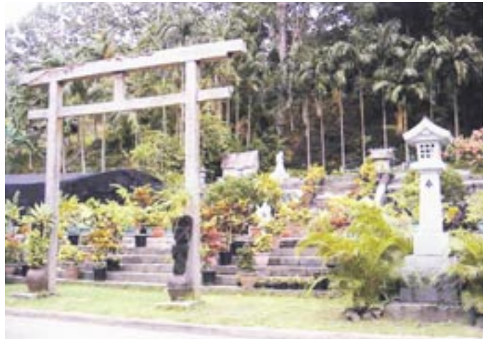
㊱ 「再建」された、旧官幣大社南洋神社 (「鳥瞰図」の左上、二の鳥居の左側、拜殿・本殿部分の石段・基壇の上に「再建」された)