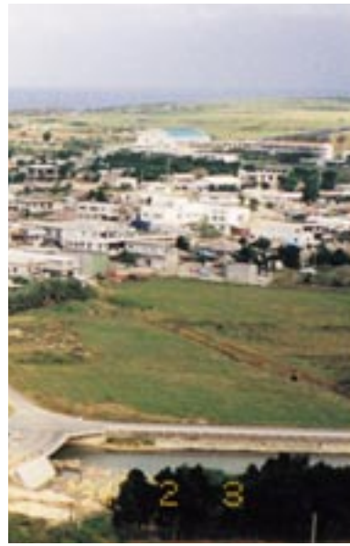
194 2 3