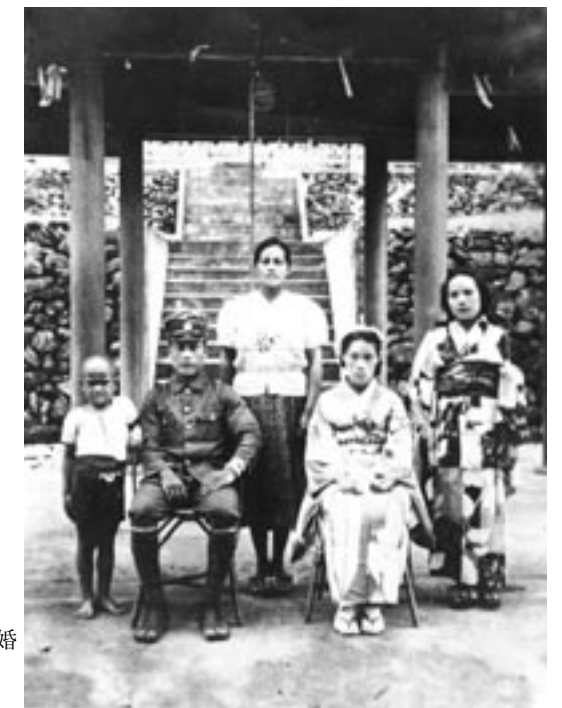
㉛ 旧台湾 花蓮港庁下, カウワン祠での神前結婚式時の記念写真 (先住民タロコ族, 撮影年不詳)