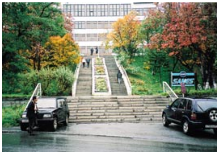
㉔ 旧樺太 真岡支庁、サハリン郵船会社が建つ真岡神社跡 (石段、石組側壁、手水鉢、燈籠基壇などが残存)