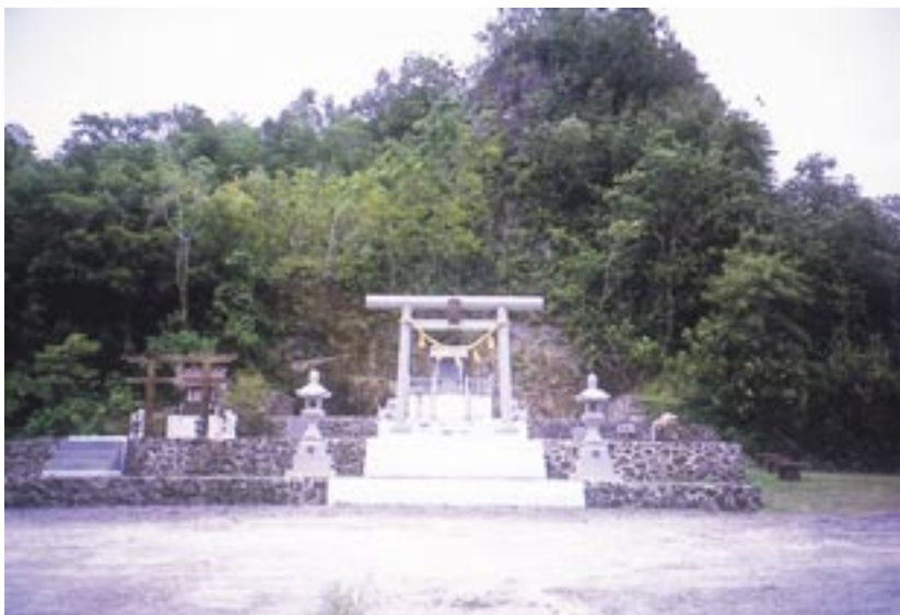
㊲ 旧南洋群島 ペリリュウ島、旧ペリリュウ神社跡地の近くに再建されたペリリュウ神社