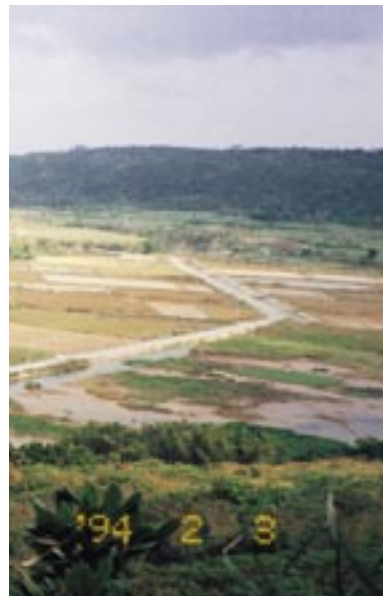
194 2 3