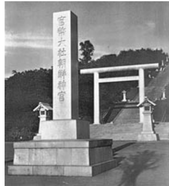
㉘ 官幣大社朝鮮神宮の大石段と社号標 (『恩頼 朝鮮神宮御鎮座10周年記念』, 1937年11月, 朝鮮神宮奉賛会編, 72頁)

戦前，アジア地域に建てられた神社（海外神社）は，現在判明しているものだけでも1600余社にのぼる。海外神社には，官幣大社朝鮮神宮，同樺太神社，同南洋神社など，日本国政府により，その地域の統治のシンボルとして建てられた「政府設置（奉斎）神社」と，海外に移住した日本人が厳しい生活の安穩を祈願する為に建てられた「居留民設置（奉斎）神社」の2種類があった。1930年代以降には，海外神社は全体として，現地人の「皇民化」にも大きな役割を果たした。