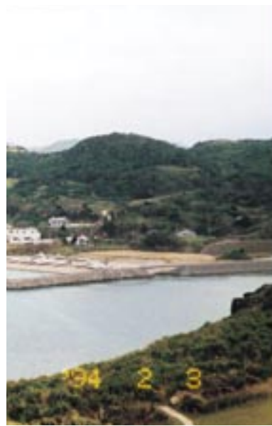
194 2 3