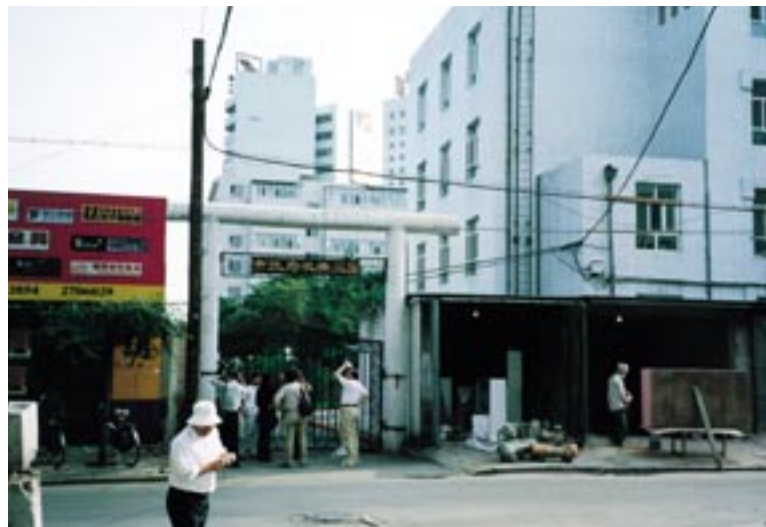
㉓ 旧満州 新京（長春）、幼稚園に改変された新京神社 (鳥居、本殿などが残存)