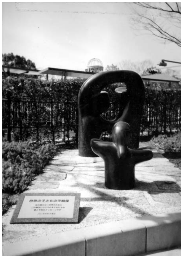
写真9 世界の子どもの平和像

1967（昭和42）年7月15日、動員学徒慰霊碑は、広島県動員学徒犠牲者の会により、第二次世界大戦中、労働力の不足を補うため、動員学徒として奉仕し、戦禍に巻き込まれて死亡した子どもや、原爆の犠牲者を含めた約1万人の学徒の霊を慰めるために、原爆ドームの近くに建立された。