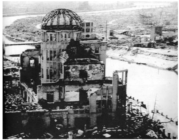
写真2 被爆直後の原爆ドーム（昭和20年末頃）（『原爆ドーム Hiroshima Peace Memorial』1998）

った。宇品港は、日清戦争時には大陸への軍用輸送基地として発達していった。また、広島駅と宇品港を結ぶ軍用鉄道（宇品線）が敷設された。これらの軍事施設は広島城、広島駅、宇品周辺に集中し、当時の市内の約10%を占めた（広島平和記念資料館編1999：14）。1945（昭和20）年4月には、本土決戦に備えて設けられた第二総軍司令部が広島に置かれた。1945（昭和20）年当時、広島市には、相生橋と呼ばれるT字型のめずらしい橋があった。この橋は、広島市の東西の南側の中島、吉島地区を結ぶ橋としての役割を担っていた。この橋が、原子爆弾投下の目標となった。実際、アメリカ軍のB29爆撃機、エノラ・ゲイ号から投下された原子爆弾爆発の場所は、相生橋の東南約300メートル地点、当時の細工町の島外科病院の上空約580メートルと考えられている。8月6日の広島への原子爆弾投下のエネルギーは、熱線35%、爆風50%、放射線15%であったと報告されている。その爆発の中心部の温度は摂氏1万度を超え、その爆心地の地表温度は、およそ3千度から4千度だったとされている。この爆弾の炸裂は巨大な爆風を起こし、その中心地は最大風圧1平方キロメートルあたり35トン、そして最高風速は秒速440メートルであった。爆発と同時に、数秒後に、爆発点に周囲の空気が白熱状態に輝く火球が生じた。この火球は、1万分の1秒後には直径約28メートルまで広がり、温度は摂氏約30万度近くになった。爆発の瞬間、強烈な熱線と放射線が四方へ放射されるとともに、周囲の空気がものすごい力で膨張し爆風となった。この爆発によって生じた空気の乱れにより、原子雲が上昇気流によって吹き上げられ、成層圏の下端に達すると放射能を帯びた雲の柱がキノコの傘のように数キロメートル横へ広がった後、風に吹かれて周りの大気の中にくずれていったという。建物の約85%が爆心地から3キロメートルの範囲内にあったため、被害は市の全域におよび、建物の90%以上が消失もしくは破壊された。原子爆弾投下後、市街地は火災や嵐、竜巻と共に、放射線を帯びた黒い雨が8月6日午前9時から午後4時にかけて、爆心地の北部から西部にわたって移動しながら激しく降った。真っ黒い泥の多いねばりの