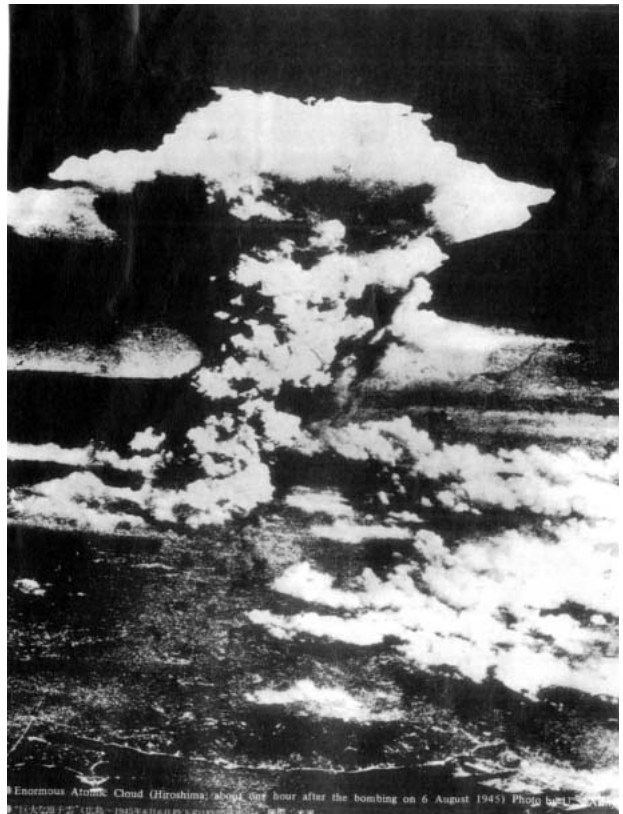
写真1 Atomic cloud（巨大な原子雲） 1945（昭和20）年8月6日 広島上空より米軍撮影