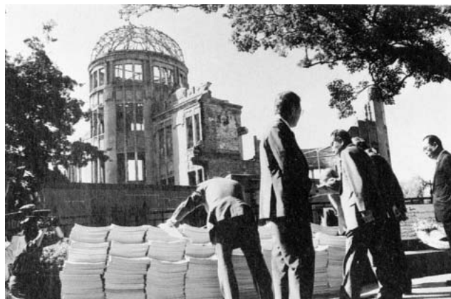
写真5 ドーム前に積み上げられた署名。1993（平成5）年10月1日原爆ドーム前で（『廃墟の中に立ち上がる平和記念資料館とヒロシマの歩み』2005年広島平和記念資料館編

そのほか爆心地を中心に残された建物は、以下のとおりである。島病院は、爆心地から0キロメートル、爆心地の中心に位置していた。1933（昭和8）年8月31日、島病院は細工町の島郵便局東隣に開院