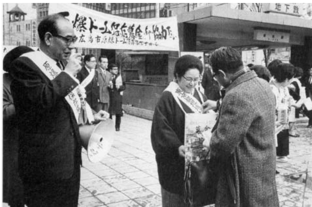
写真4 第1回原爆ドーム保存募金で東京・銀座で街頭募金に立つ浜井市長（1967年）