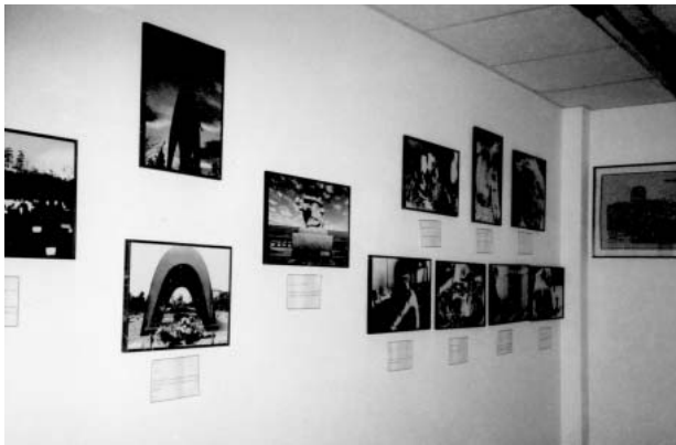
写真14 広島原爆の展示（ブラジル、サンパウロ市の広島県人会にて）