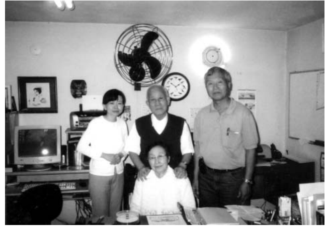
写真11 在ブラジル原爆被爆者協会にて