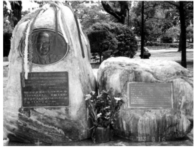
写真8 ノーマン・カズン像

科学者、湯川秀樹氏を記念する碑もある（広島平和記念資料館1999：81）。平和の像「若葉」・「湯川秀樹歌碑」は、1966（昭和41）年5月9日に、広島南ロータリークラブによって設立された。湯川秀樹氏は、「中間子理論」を確立した日本初のノーベル物理学賞を受賞した人である。湯川氏は、1954（昭和29）年のアメリカの水爆実験に衝撃を受け、以後、世界科学者会議（バグウォッシュ会議）を開催し、核兵器と戦争の廃絶を訴えた。像は、少女とその傍らで少女を見上げている小鹿で、高さ1.8メートルのブロンズ像である。その像には「まがつび