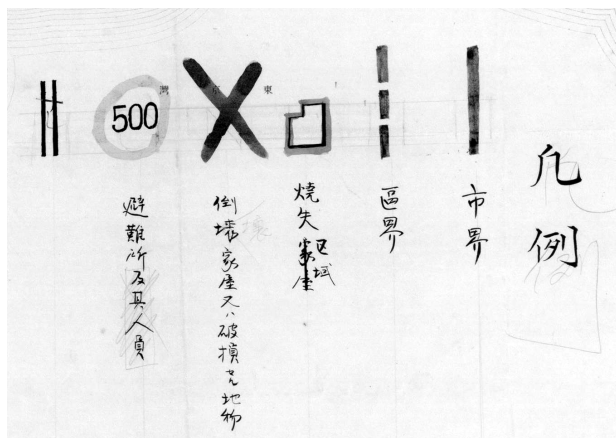
図1 「震災地応急測図原図」凡例（「洲崎」から関係箇所を引用）