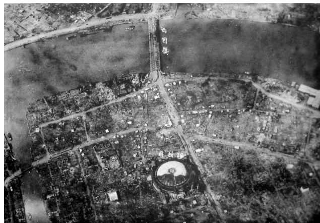
図27 両国橋・震災後撮影（戒嚴司令部 1924）所収

気球隊の初日に撮影した写真に摂政宮が執政した赤坂離宮の1枚が含まれている。同時に東京、横浜を中心とした被害地の航空写真も陸軍省に呈出され、状況把握するための重要手段となっていた。