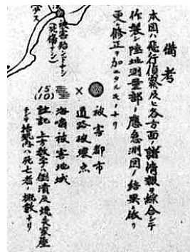
図24 「東京近県震害情况概見図」備考（大日本雄弁会講談社編 1923）

1924年5月、陸軍航空学校の本部と下志津、明野両分校は、それぞれ陸軍飛行学校として独立し、所沢は操縦、下志津は偵察・通信、明野は爆撃と専門化教育が強められた。そして1年後の1925年5月に、航空兵が歩兵、騎兵、砲兵、工兵と並んで独立した