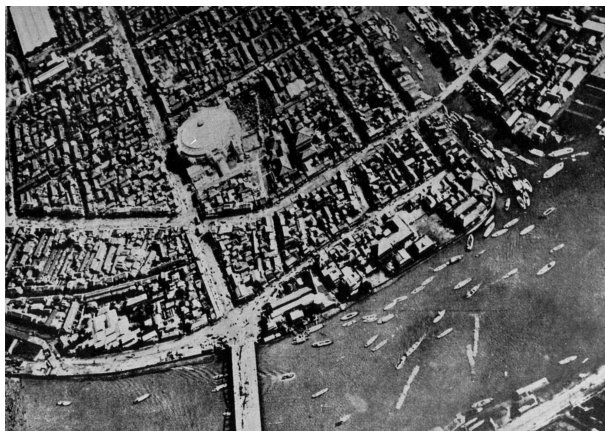
図26 両国橋・1922年撮影（野沢編 1955）所収