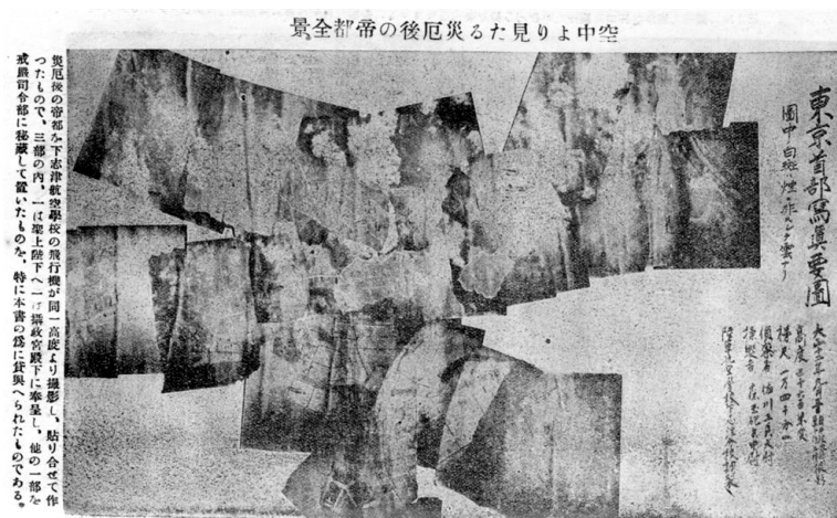
図20 (大日本雄弁会講談社編 1923) 所収東京航空写真集成