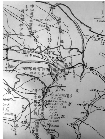
図19 戒厳軍隊管区区分・局部（関東戒厳司令部編 1924）

亀戸以東総武線鉄道一本所緑町—両国橋一本石町—東京駅—日比谷公園北端—宮城—麴町通—塩町通—新宿駅—甲武及青梅線を境に、北部は森岡中将が