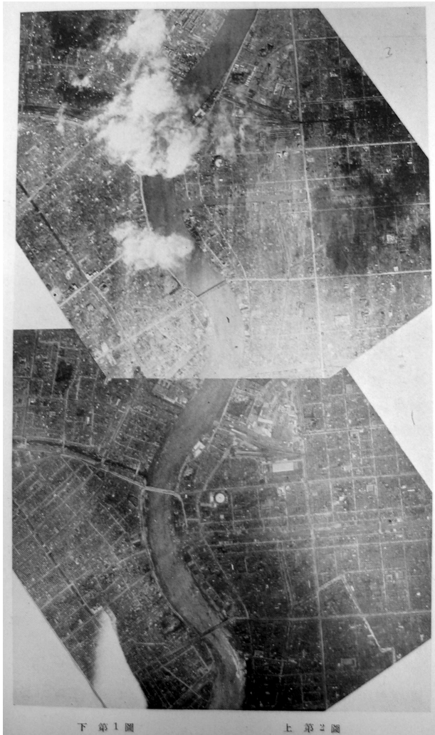
図25 両国橋・上は1923年9月撮影、下は1923年8月撮影（丹羽1935）所収