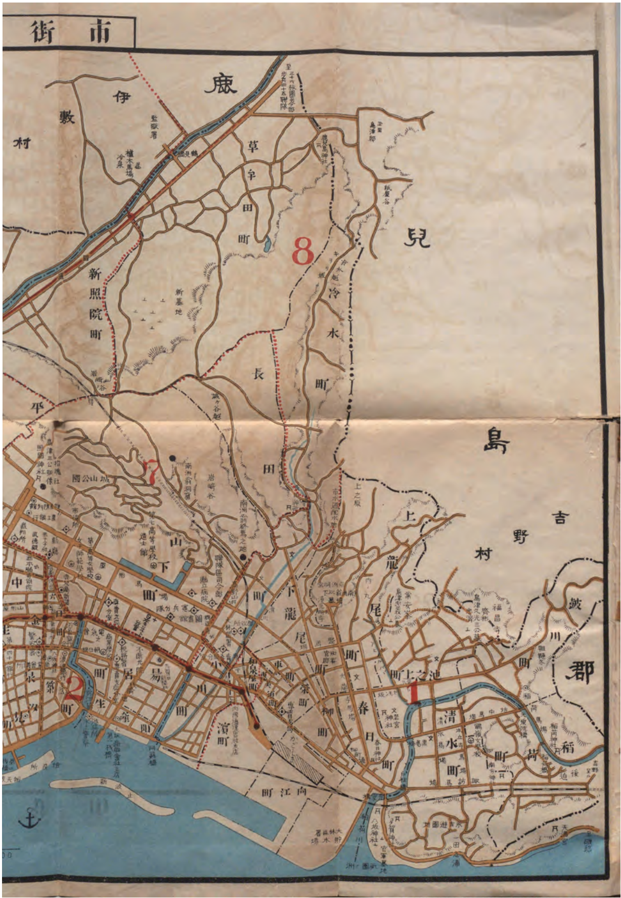
鹿児島市街便覧図 (若松長義 製『(实地測量地番里程入) 鹿児島市街便覧図』吉田書房、1918年) (国立国会図書館蔵、デジタルコレクションより)