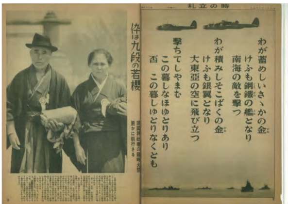
図14 写真週報 1943年5月5日号「息子の英霊を訪ねる両親」

育年限の2年延長、および小学校教科書の国定化（開始は1903〔明治36〕年からと時間的には前後する）と相次ぐ改訂である。戦前の小学校教科書は、検定制度のもとにあっても、各種の「軍国美談」一日清戦争の“木口ラッパ兵”“水兵の母”、日露戦争の“乃木希典”“広瀬武夫”“橘周太”“一太郎やあい”——を教材としていたが、さらに第2期国定教科書の『尋常小学修身書 巻四』（1911〔明治44〕年使用開始）から、「第一 天皇陛下」「第二 能久親王」「第三 忠君愛国」に続けて「第四 靖国神社」の記述を登場させるようになる（これは以後の改訂においても継続される）。その記述は次のようである——「東京の九段坂の上に、大きな青銅の鳥居が、高く立っています。その奥に、りっぱな社（やしろ）が見えます。それが靖国神社です。／靖国神社には、君のため国のためにつくしてなくなった、たくさんの忠義な人びとが、おまつりしてあります。（略）／私たちの郷土にも、護国神社があって、戦死した人々がまつられています。／私たちは、天皇陛下の御恵みのほどをありがたく思ふともに、ここにまつられてゐる人々の忠義にならって君のため国のためにつくさなければなりません」。戦死者を祀る地方の神社の頂点に位置づけられた〈靖国神社〉の壮さ・静謐さが強調され、国のために命を捧げる行為を忠君愛国の極限形として美化し、天皇陛下の恵恩を「ありがたく」受容「しなければなりません」という叙述と命令の主体なき文体（軟化された勅語調とも、勅語の口語化ともいべき文体）が、その比類なき特徴である。