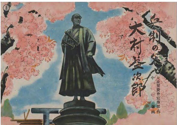
図⑩ 『兵制の父大村益次郎』

『時計は生きてゐる』1941.9では、母一人子一人の時計修繕工が、支那事変が始まってまもなく陸軍歩兵上等兵として出征・戦死し、「(駅頭は黒い喪の凱旋―)戦友の胸に抱かれ英霊は今母親のもとに」無言の帰還をする。届いた遺品の日記帳には「お母さん、名誉の戦死を遂げたらこの時計を私だと思ってください」と書かれている。コチコチと動く遺品の時計を見て「倅は生きている、時計は生きている」と思うしかない軍国の母はそのまま多くの遺族の姿でもあった。／南紀州の山村を背景とした『炭焼く妻』1942.1では、夫が出征して3カ月で戦死する。病身の父・3歳の娘・お腹の子供を抱えた妻が