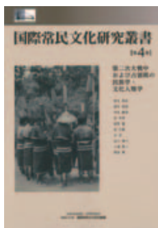
国際常民文化研究叢書 第4巻 第二次大戦中および占領期の 民族学・文化人類学