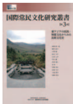
国際常民文化研究叢書 第3巻 東アジアの民具・物質文化からみた 比較文化史