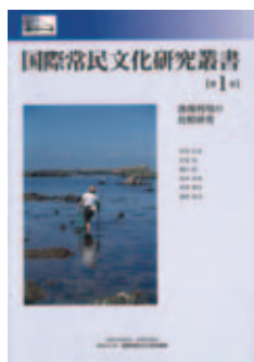
国際常民文化研究叢書 第1巻 漁場利用の比較研究