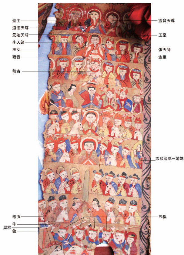
口絵 16 総壇神画