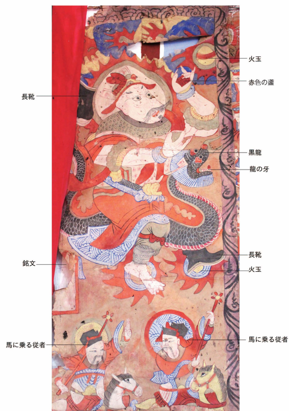
口絵 13 海旛張趙二郎神画