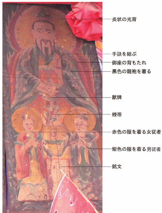
口絵 1 元始天尊神画