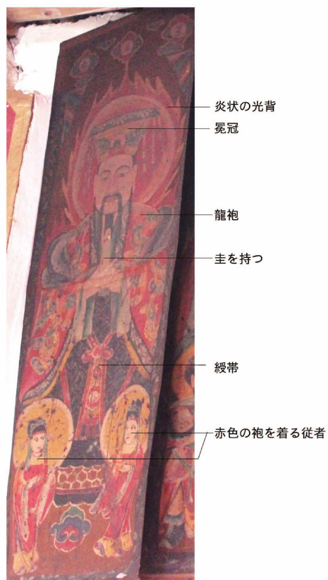
口絵 4 聖主（星主）神画