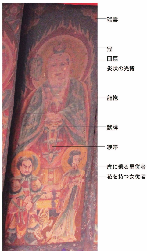
口絵 3 道德天尊神画