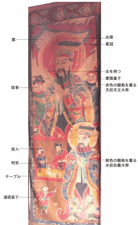
口絵 20 天府神画