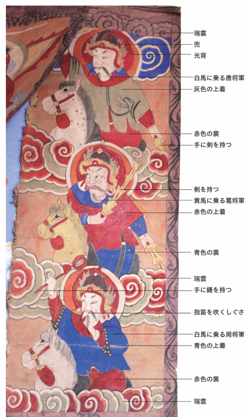
口絵 14 唐・葛・周三將軍神画