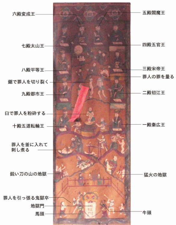
口絵 18 拾殿神画