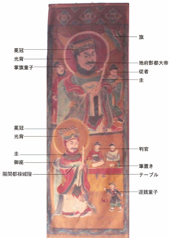
口絵 19 地府神画