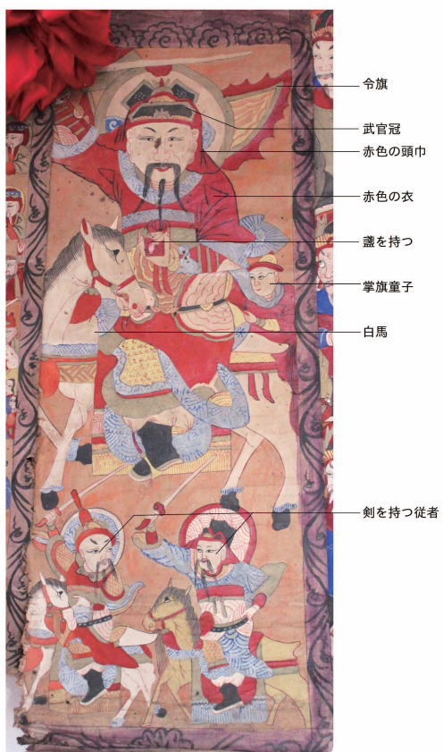
口絵 15 太尉神画