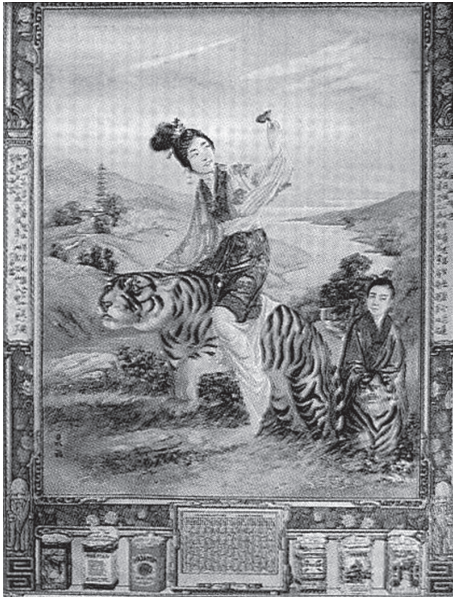
図1 1925年梁鼎銘作の「上山跨虎」。英美煙が大量に印制した。

には英美煙は南洋兄弟のものをはるかに上回っていた。さらに、広告競争に勝利するため、英美煙は全国各地の様々な文化状況に合わせ、異なる題材の広告画を出していた。例えば、内陸では伝統的な服装の仕女画を出していたが、これらの前近代的な仕女画の多くは、周慕橋によって描かれたもので、内陸の人々に大いに歓迎された (21) 。とはいえ、南洋兄弟も手をこまねいていた訳ではなく、絵師の潘達微が1929年に死去した後、すぐに新たに広東国画研究会の伝統画師たちを招聘し、伝統的中国画、金石、書道などの方法で広告画を作成し、流行ファッションの女性図像を売りにしていた英美煙の広告画 (22) に対抗した。