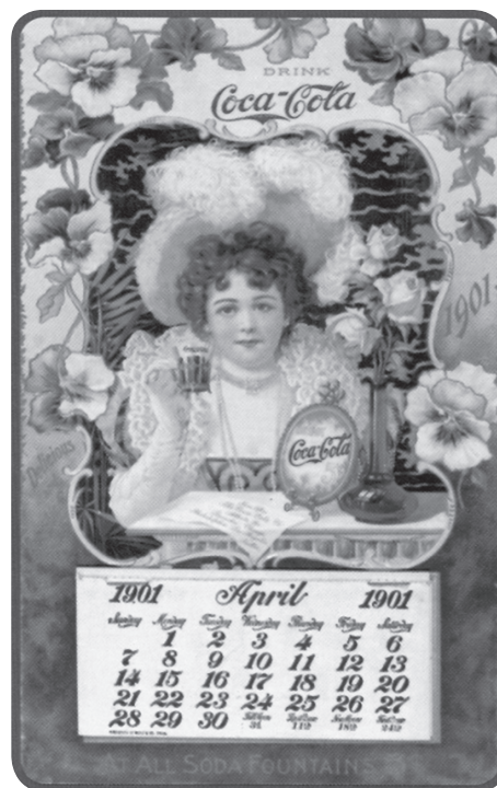
図6 20世紀初頭、アメリカのコカ・コーラ社は既に美女を描いた広告カレンダーの図像を使い始めていたが、一貫して保守的なイメージを保っており、セクシーなものやヌードはなかった。