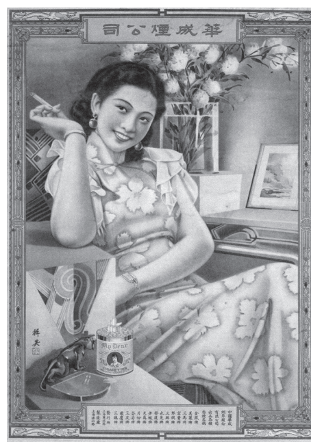
図2 美麗牌は華成煙公司の主力銘柄で、女優呂美玉の写真を使用して訴えられたことで有名になった。

広告効果が良好であったため、女性の図像は広告に使われたのみならず、タバコの銘柄の商標にもなった。筆者の推算によれば、1920～1940年代、女性または女性の名前をタバコの商標としたものは、52社のタバコメーカーで少なくとも72種あり、美女、蟹美人、美人、西美女、美妹、美麗 (28) (図2)等の名が付けられた。胡蝶、梅蘭芳(男性が演じた女性役)、黄慧如、嘉宝などの有名俳優の名前もタバコメーカーが奪い合う対象で