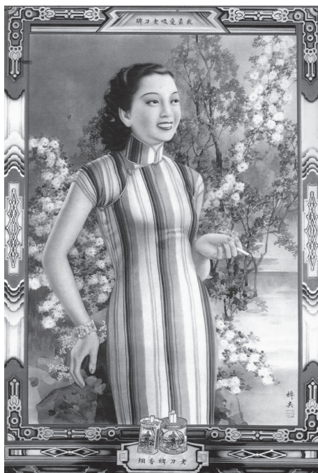
図3 喫煙する女性というイメージで、英美煙は多くの女性消費者を惹きつけた。杭稚英作。

カレンダー広告画の「摩登美女」についての構想の多くが、清末に一時流行した『点石齋画報』や