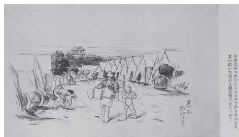
図 12 赤城泰舒「宮城前避難天幕」