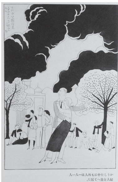
図 13 水島爾保布「帝国ホテルから逃れた外人」