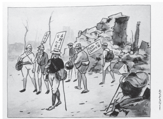
図 14 丹羽禮介「親は子を子は親を連日尋ね歩く人探し」