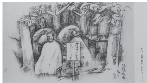
図 11 赤城泰舒「日比谷所見」(緑陰の床屋)