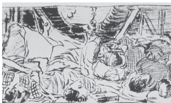
図 16 丹羽禮介「戒厳令下の自警団」