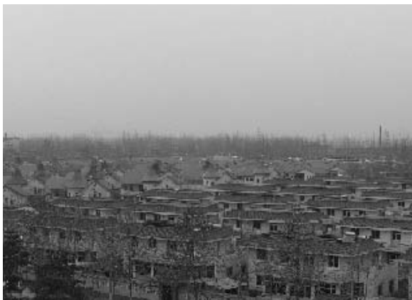
写真26 近代的な韓村河村の住宅群

その韓村河村は北京市の南西、およそ40kmのところに位置する。その景観はおよそこれまでの中国の農村とは異なる。中心部は舗装された道路によって整然と区画され、西洋・中華風の鉄筋コンクリート製の二階建ての住宅が建ち並び（写真26）、その脇にはこれまた洒落たマンションが幾棟も林立している（写真27）。道路には奇抜なデザインの街灯が設置されている。広