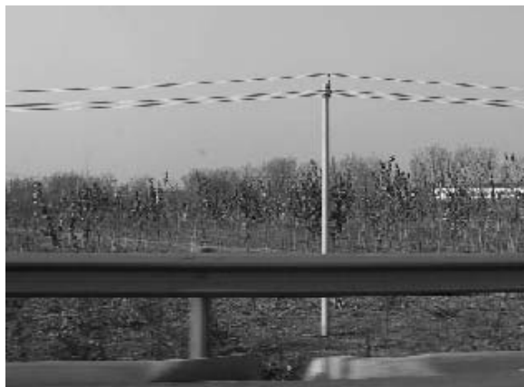
写真12 植林が進む耕作地 (2004年11月筆者撮影)

地を次々と潰して植林し、グリーンベルト地帯を造成しようとしている。オリンピックの選手村や各種の競技施設はこの中に建設される予定である。この景観から中国政府のオリンピックに対する強い意志と強大な権力を読み取ることができる。