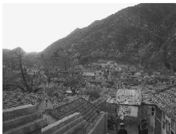
写真23 霊水村 (2004年11月筆者撮影)