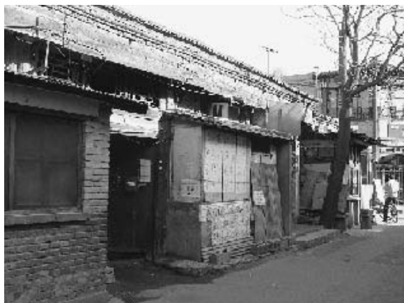
写真7 清代に建てられたと推察される四合院 (2004年11月筆者撮影)

写真11は五環路の北側の⑦海淀区西三旗付近の様子である。中国では1980年代から1990年代にかけて、住宅制度が徐々に改正され、公有賃貸住宅の払い下げや民間企業および個人による住宅の建設、販売、購入が認められるようになった。あわせて住宅ローン等に関する法律も整備された。1992年には土地所有権の譲渡が認可され、1998年には住宅の現物支給が廃止された。すなわち、北京市民は自由に不動産売買ができるようになり、また自由に居住地を選択できるようになったのである。開発地区の住民は建設された住宅を優先的に安い価格で購入でき、転居する場合は補助金が支給されるようになった。その結果、近郊の農村地帯は写