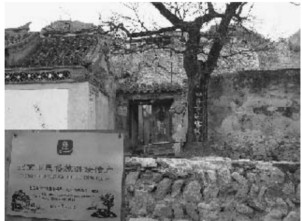
写真21 川底下村の民俗観光接待戸 (2004年11月) 農家をそのまま宿泊施設として利用している。民俗観光接待戸に指定された農家の入口には、写真左下のような表示版が掲げられている。