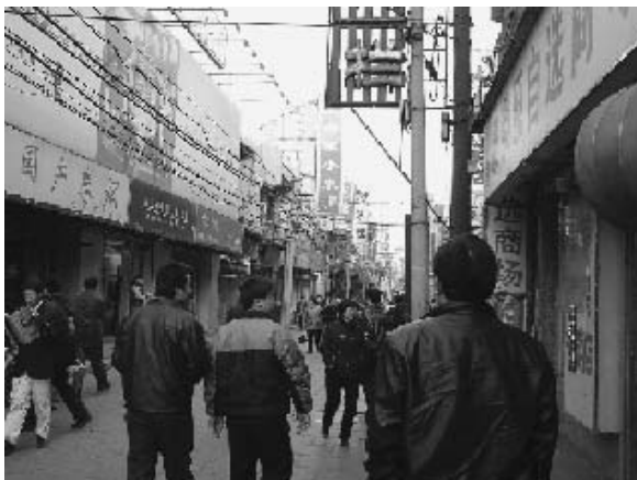
写真3 前門付近の商店街 (2004年11月)