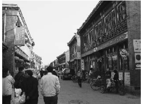
写真5 伝統的な雰囲気醸し出す琉璃廠の街並み