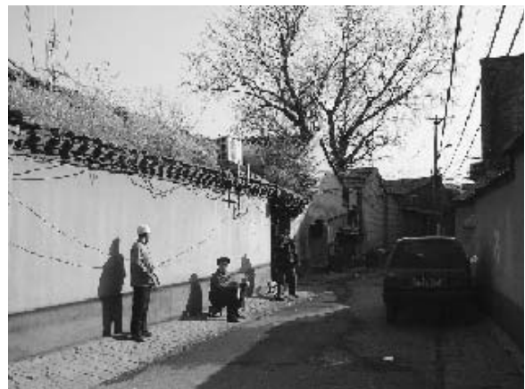
写真6 人々が憩う胡同 (2004年11月筆者撮影)