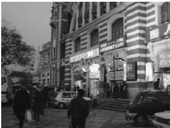
写真4 前門に立地する日系のコンビニエンスストア