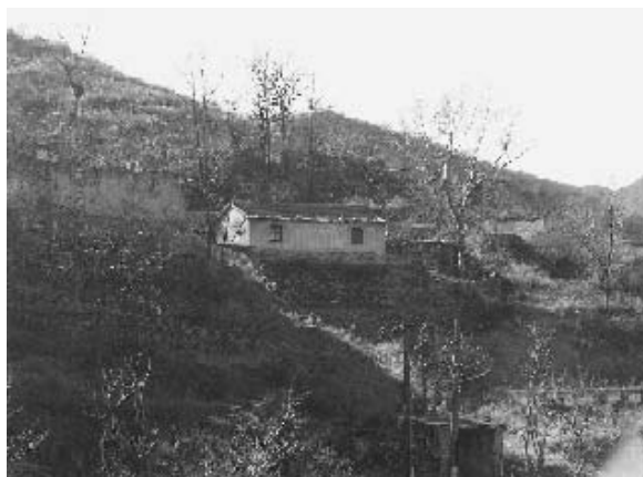
写真15 廃村の中の補修された家屋 (2004年11月)