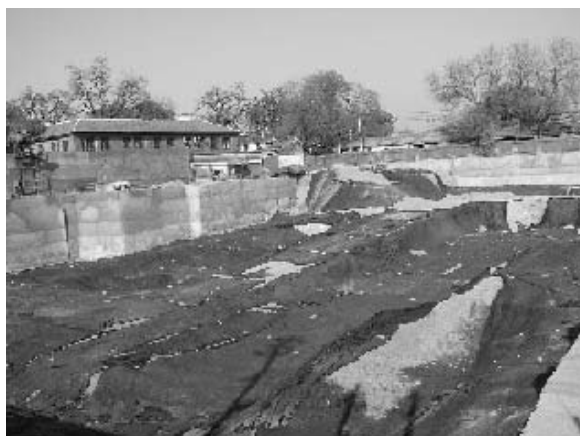
写真8 四合院の取り壊し跡地 (2004年11月筆者撮影)