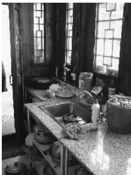
写真22 水道が完備された川底下村の農家の台所 (2004年11月筆者撮影)

2003年現在、北京市内には15万8777の郷鎮企業が立地している (4) 。その中で、近年、最も注目されたのが、