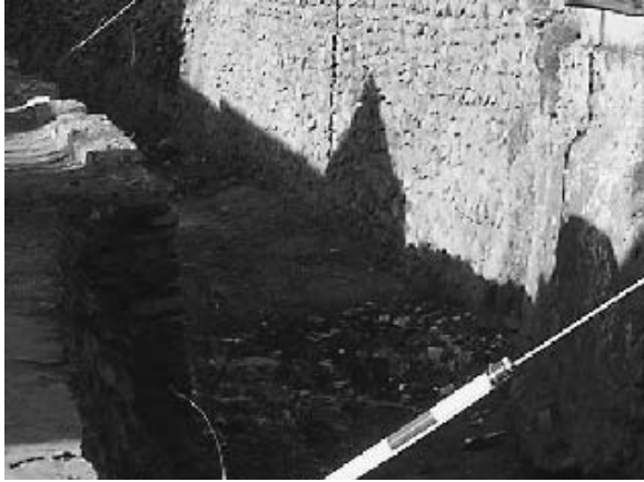
写真25 ゴミが散乱する川 改革開放以前の各家庭から排出されるごみは、主に残飯などの自然分解可能な有機物であった。しかし、現在では塩化ビニール製の袋や容器などが増加し、それらをそのまま昔の生活感覚で放棄するため、川底にゴミが溜まるようになった。

韓建集団という建築関連の郷鎮企業を立ち上げ大成功を収めた⑭房山区韓村河村である。