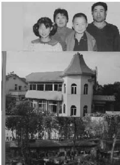
写真30 資料館に展示してある村民のパネル (2004年11月筆者撮影) 上段が家族、中段が現在の住居、下段が以前の住居

をもってみられている。また、全国からはもちろん、江沢民前国家主席など政府の主だった幹部らも次々に視察に訪れている。韓村河村は改革開放における一つの象徴的存在となっている。