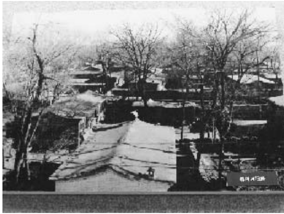
写真29 かつての韓村河村の様子 (韓村河村資料を接写)