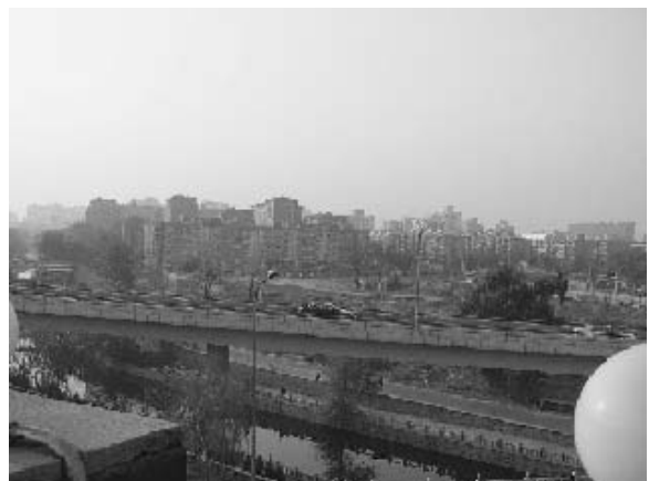
写真9 西城区徳勝門付近における再開発の様子 (2004年11月)