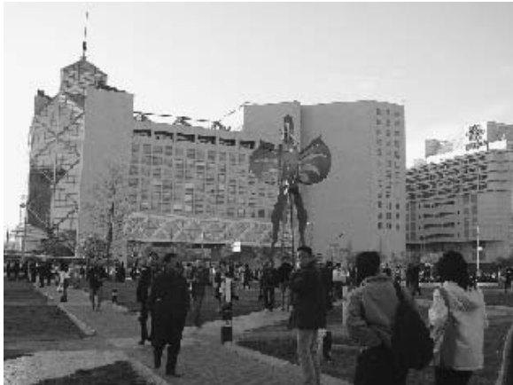
写真2 西单そばの中国人民銀行 (2004年11月筆者撮影)