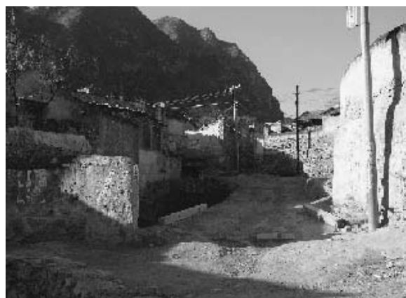
写真24 霊水村集落内部の様子 (2004年11月筆者撮影)