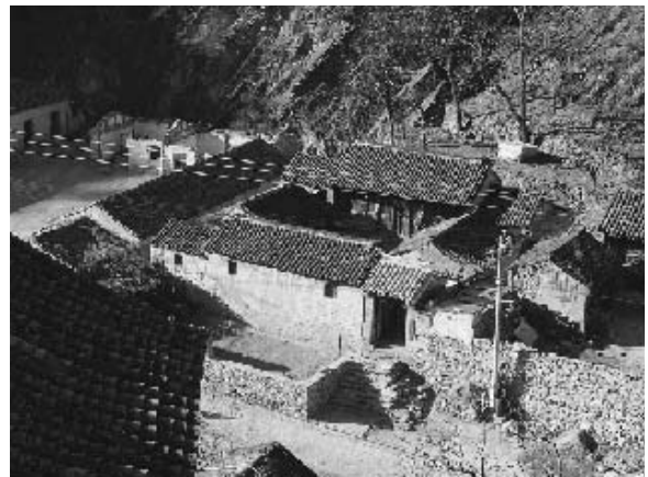
写真20 川底下村の四合院 (2004年11月筆者撮影)

かつての川底下村は、農業を主体とする貧しい山村であった。主な農作物はとうもろこしであり、耕地は集落周辺の山を切り開いて作られ、場所によっては山頂付近にまで分布する。水源は天水が主であり、天候に左右された。しかし、現在では川底下村は観光地として成功し、北京市の中でも豊かな農村の1つとなっている。同村には、四合院を中心とするおよそ400年前の明・清代に建てられたという民家が残され（写真20）、テレビ放映によって注目を浴びたこともあり、1990年代後半から、大幅に観光客が増加した。国内外を問わず多くの観光客が訪れる。川底下村には旅行管理局が組織されている。道路は石畳風に舗装され、駐車場も整備されていた。各四合院は石畳の細道で結ば