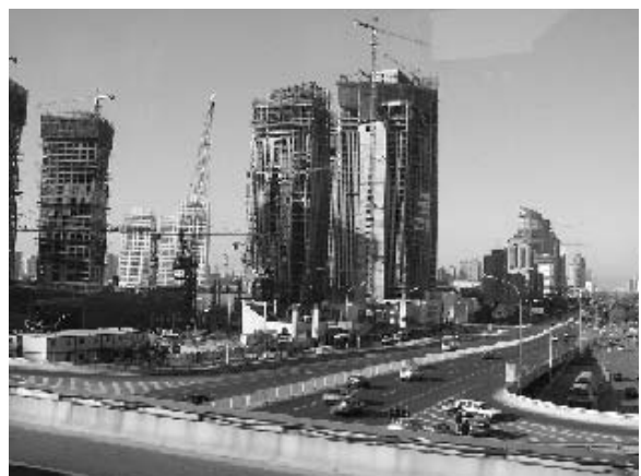
写真10 二環路沿線のビル建設現場 (2004年11月筆者撮影)