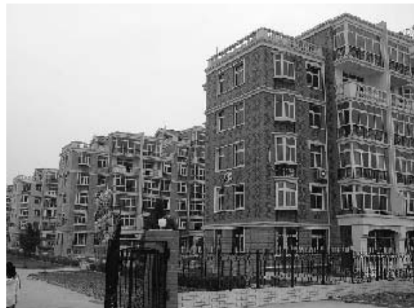
写真27 韓村河村で売り出し中のマンション (2004年11月筆者撮影)

村民の生活は一変した。同村の資料館には、村民全員の以前と現在の住居、家族写真をまとめたパネルが誇らしげに展示されている（写真30）。電気や水道、ガスなどのライフラインが整備され、各家には大型テレビや冷蔵庫など各種の家電製品が普及している。自家用車を持つ家も多い。周辺の農村では「嫁に行くなら韓村河の男性のところ」といわれるほど憧憬の念