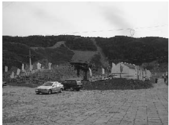
写真17 旧万佛堂村で進むスキー場の建設 (2004年11月筆者撮影)