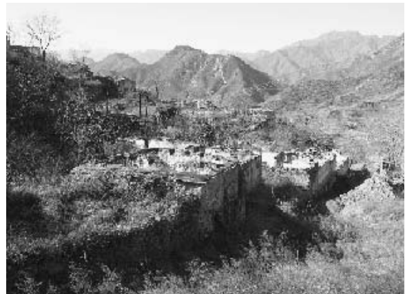
写真13 廃墟と化した旧王平口村 (2004年11月筆者撮影)

北京市の環境問題はオリンピック誘致運動の前後に始まったものではなく、改革開放以前から深刻な状況にあった。特に大気汚染は大きな問題であった。工場や各家庭で燃料として使用される石炭がその主な原因である。近年では急増した自動車の排気ガスも大気汚染に拍車をかけている。また、乾燥した内陸西北部の荒廃地から砂塵が吹き込み、北京名物の冬の砂嵐を引き起こしている。そんな中、オリンピック誘致は環境問題を考え、対策を本格化させる一つの契機となった。北京市は石炭採掘の見直しと工場の移転を決定し、石炭に代わって天然ガスなどのクリーンエネルギーの使用を促進させ、煤煙や有害物質の排出抑制を図った。加えて砂嵐防止のために遠郊の農山村でも植林事業を強化した。当然、このような環境保全政策は農山村に多大な影響を及ぼした。中でも、明・清の時代から北京中心部への石炭の供給地として栄えていた門頭溝区 (3) の山村は、その姿を大きく変えることになった。一部を残して多くの炭鉱が廃鉱となり、耕地には樹木が植えられた。そのため、石炭採掘と農業によって成り立っていた集落の中には廃村・移転したものもある。写真13は廃村となった⑨旧北嶺郷の村々の1つ、旧王平