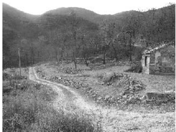
写真16 廃村となった旧万佛堂村 (2004年11月筆者撮影)

農山村では環境保全を目的とした緑化事業によって廃村が相次ぎ、様々な問題が生じている。もともと改革開放政策は農山村の余剰労働力問題を解消し、農山村経済の活性化を図ったものであった。そのため、農業に従事できなくなった住民の雇用確保は政府にとっても重要な政策的課題である。出稼ぎ労働者の増加が社