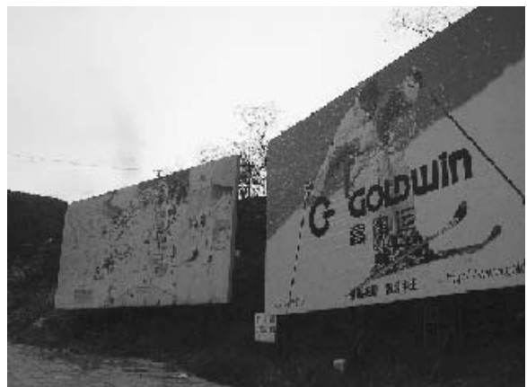
写真18 スキー場の建設現場脇に掲げられた広告 (2004年11月筆者撮影)