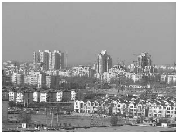
写真11 同規格の住宅群が広がる城区近郊 (2004年11月筆者撮影)

このような住宅開発が盛んになる一方で、オリンピックへ向けての緑化事業が進められ、植林のために廃村となった農村も多数存在する。北京市は過去、オリンピック誘致に失敗しているが、その要因の一つが環境問題であった。中国の経済成長は同時に公害という負の面を浮き彫りにし、北京市も大気汚染等の問題を抱えていた。そこで、環境に配慮したオリンピック開催都市の実現を目標とした「緑色五輪（グリーンオリンピック）」をスローガンの一つに掲げた。この緑色五輪計画によれば、2007年までに北京市の緑地面積率を50%にまで引き上げるといふ。現在、都心部では、公園を含めた緑地整備が進められているが、⑧近郊の五環路沿線（朝陽区）では、写真12のように集落と耕