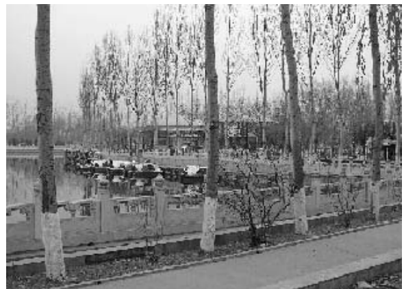
写真28 村民のために建設された人工池 (2004年11月)