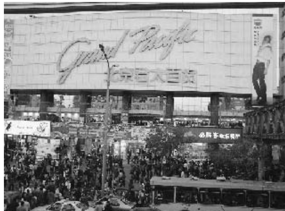
写真1 西単のデパート (2004年11月筆者撮影)

写真1は①西単のデパートである。西単は故宮の西側に位置する商業地区であり、その起源は元代にまで遡る(図2)。現代でも写真に示すような大型商業施設が複数立地し、前門や王府井とならび、北京市内で最も高次の商業機能を有する。その発展の要因は交通