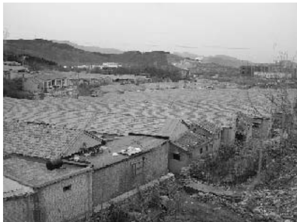
写真14 長屋のような住宅が並ぶ新北嶺郷 (2004年11月筆者撮影)