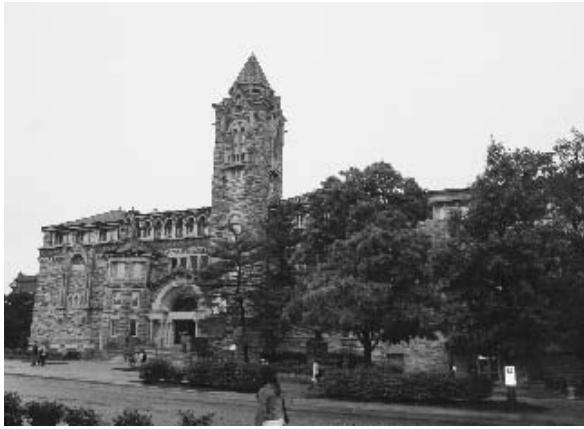
写真1 (左) キャンパスの中心部に建つ自然史博物館の威容

究図書館の2館の図書館を有する。自然史博物館のコースディレクター、John E. Simmons氏よりの説明を以下に記す (3) (写真1・2)。