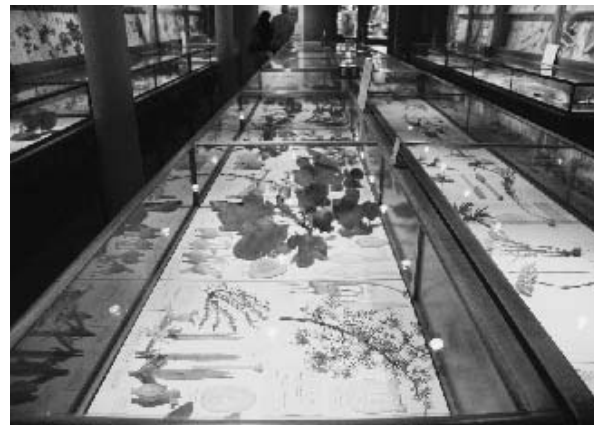
写真5（右下）自然史博物館のガラス細工で作られた植物標本のコレクション

このコースの目的は博物館で働くために必要とする理論・方法論・実践的知識を提供することで、博物館の事務スタッフや調査員として博物館で働く上で必要となる調査方法やカタログなどの執筆に関する能力を高めることにある。