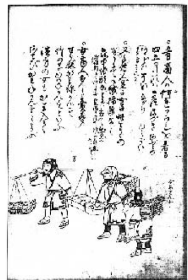
図3 女の商人・手伝人足

この他にも、『模地数里』は図4にも働く女を描いている。説明文には「町会所に集居るを呼て遣ふ。女の日用は材木其外何にてもミナれんじゃくにて背負也。酒も二斗入之樽多し、ミナ大坂も回るとてむしろはなく樽に書付有三貫文、青森弘前黒石の酒は二斗入壺貫八百文也」とあり、女が「れんじゃく」で背負っているのは酒樽なのであろう。また、『陸奥日記』には松前を船出する5月10日、「天気よし、今朝より船手御役人も御出、早朝も人足集り来りて追々船へはこふ、女人足も来て弁当の用意などするよし」と、女人足のことに触れている。