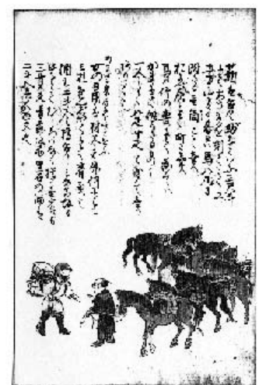
図4 女の日用・炭を運ぶ馬子