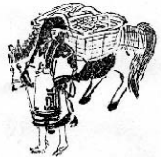
図6 魚売りの女商人 『三航蝦夷日誌』上484頁, 吉川弘文館。

札前村…日々松前の城下ニ商出す。其風俗甚おかし。其さま下に 図するとき短きアツシを着て風呂敷を冠り、馬には籠を二ツ附 而是ニ小鮑又は海鼠の類を入、又小魚等をも持来るなり。扱其風 呂敷をかぶることは此地の風品にし而、夏冬ともニ多く紺の風呂 敷を冠る也。また履ものわらんじ又は下駄等を履て来ること有る也。其は如何に下駄をはくと いハ、往来ともニ市中ニ入来るまでは皆此籠の上に乗りに来る故也。又海岸砂道なる処は至而 下駄が歩行よろしきもの也。(吉田校註 1970: 484)