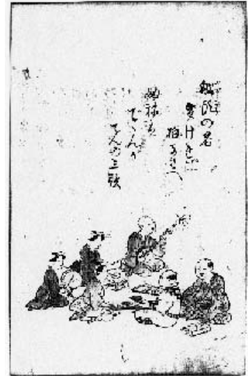
図8 船頭(かざまち)の客

めての利用であろう。図8は、松前に入港した諸国の廻船の「船頭の客」が、川原町・蔵町・中川原町に集中する茶屋で三味線・太鼓を聞きながら酒食しているところで、その中に「アツシ」を着た男が一人描かれている。「アツシ」は女以上に男の労働着・生活着として定着していた様子が『模地数里』からも窺うことができる。