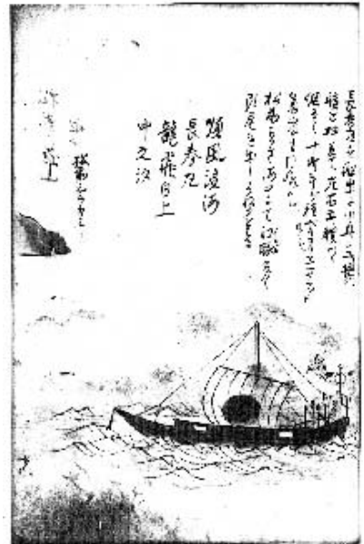
図1 御用船長春丸 『模地数里』下所収。独立行政法人国立公文書館内閣文庫所蔵。以下、図3～5, 7, 8, 10は出典同じ。

紹介にとどめておくが、淡斎如水(蛭子吉蔵)『松前方言考』(1848年・嘉永1序、国立国会図書館