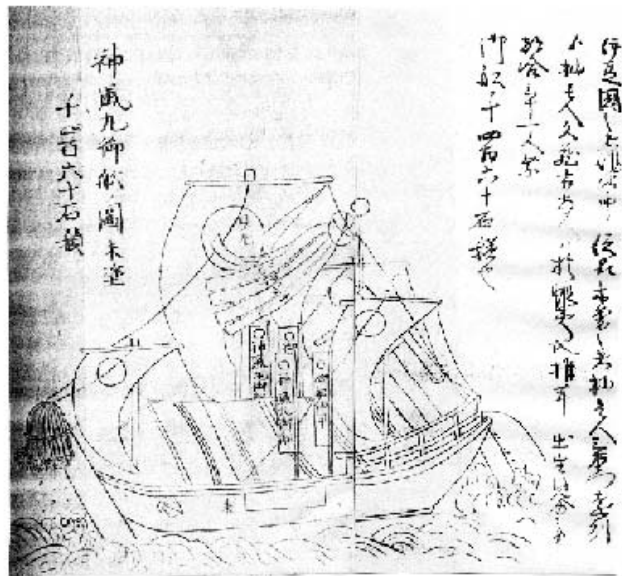
図2 御用船神風丸 『蝦夷地開発記』所収。北海道大学附属図書館北方資料室所蔵。