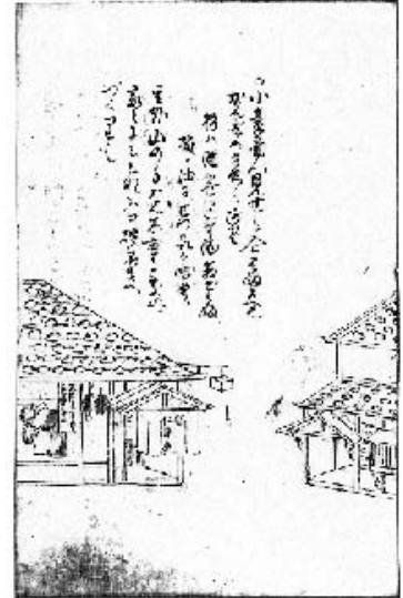
図5 小売商人の見世

『模地数里』にも松前城下で「アツシ」が売られていたことを示す図が描かれている。図5の仁岸屋と暖簾にある「小売商人見世」の中をよく見ると、「アツシ」と思われるアイヌ模様のついた薄い茶色の衣服が吊り下げられている。他に白い無地の衣服と、蓑もしくは毛皮のようなものが掛っている。『陸奥日記』には「アツシハ松前にてハ多く着る事にて、船方の者ハ不残着る故売処所々に有。縫もやうの有ハ一貫五百、二貫、三貫、ぬひなき八百ほど也。又白くのがらむしにて織たるハ、ユタルベといひてカラホトも出、今ハ金貳分位なり」(5月2日)とあり、「アツシ」を売る店が方々にあり、その値段まで記しているのは貴重である。「ユタルベ」とあるのは、おもに樺太アイヌがイラクサという草を使って織ったレタラペのことであろう。