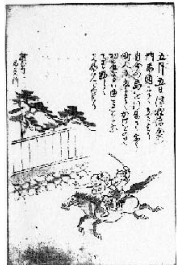
図10 5月5日の馬乗りの行事

『模地数里』にはもうひとつ馬が描かれている場面がある。図10の5月5日の節句に行われる馬乗りの行事がそれである。説明文には「津軽陣屋の門前通にて在々より自分の馬を引来て乗也、町人も爰にきてかけをのり、巧者なるハ曲馬をも乗、馬も夥しく見物くんじゆせり」と書かれている。央齋はわずか2週間程度の松前滞在であったが、そのなかで見物することができた年中行事であった。これによると、馬乗りしているのは武士ではなく、在の百姓や町の住民たちであったことになる。前述してきたような馬子たちが主人公であったのだろう。弘前藩の陣屋があったのは『模地数里』の松前図によると、馬形町方面の高台にあった。