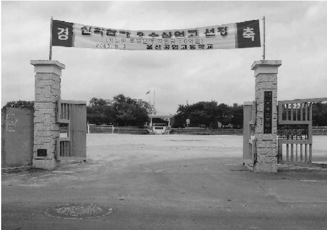
写真6 蔚山工業高校正門 (2005. 8.17筆者撮影)