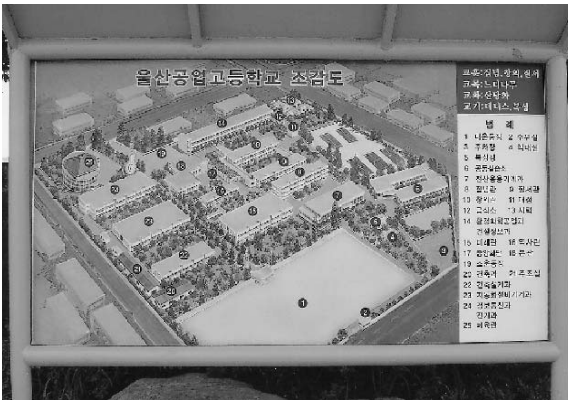
写真7 蔚山工業高校構内案内圖 (2005. 8.17筆者撮影)