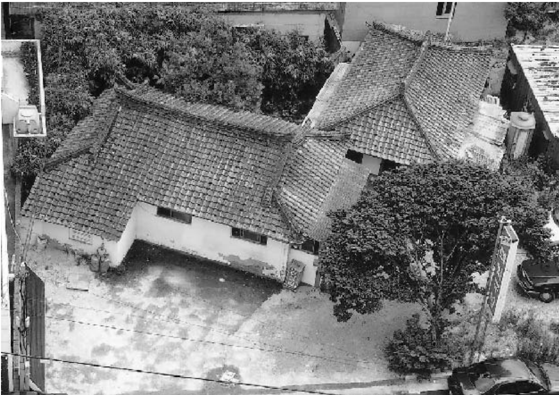
写真11 旧達里駅付近の古民家