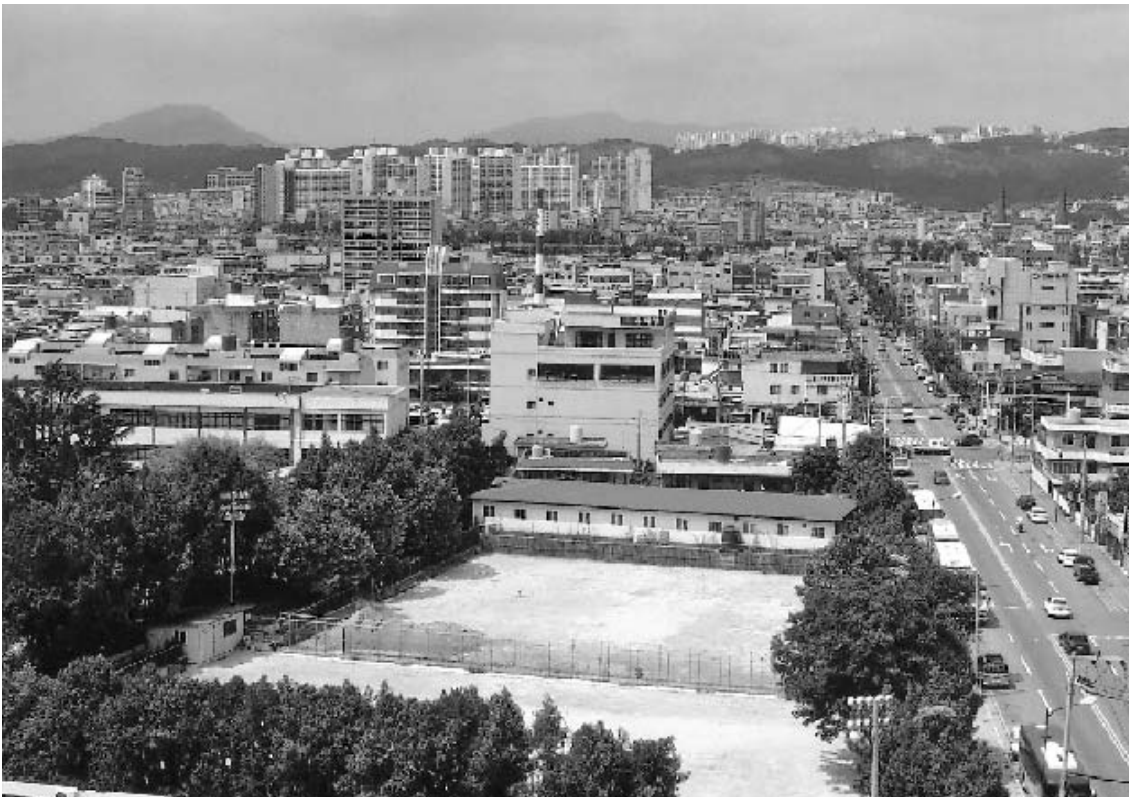
写真17 達洞から北西方向（2005. 8 .17筆者撮影）