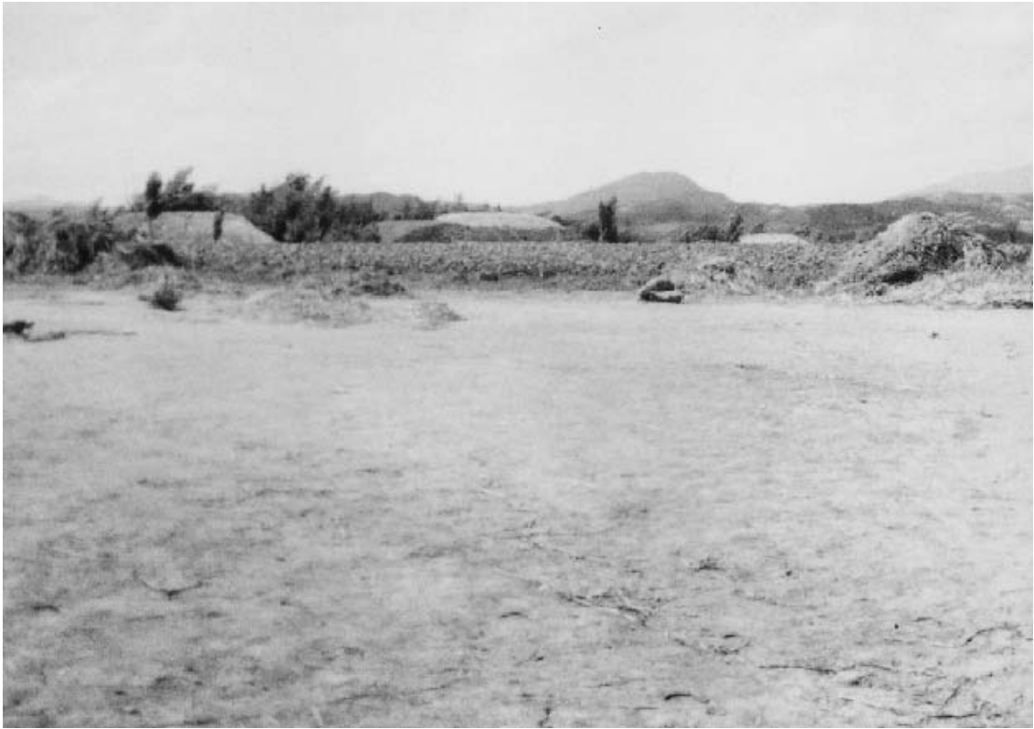
写真14 達里の広場から西方向