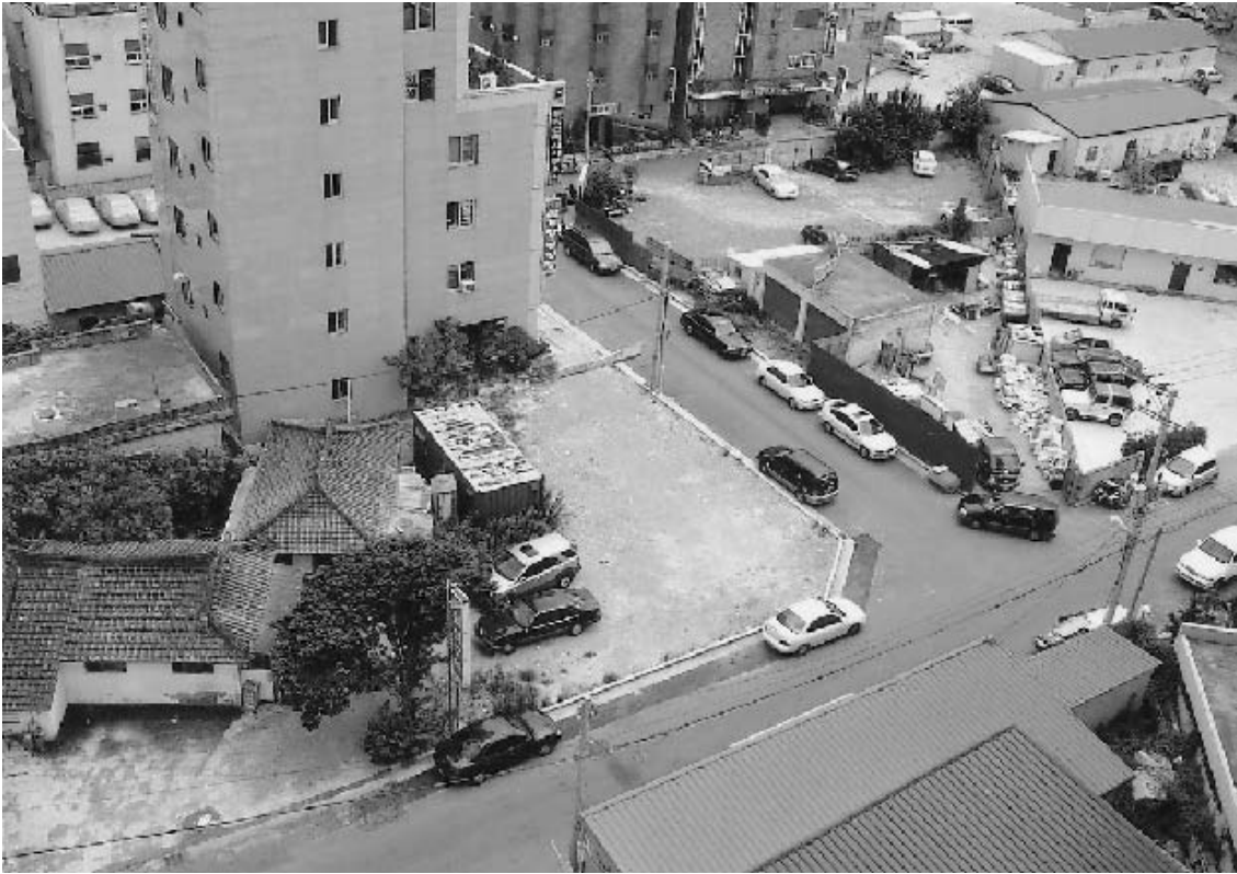
写真10 旧達里駅付近の鉄道線路跡 (2005. 8.17筆者撮影)