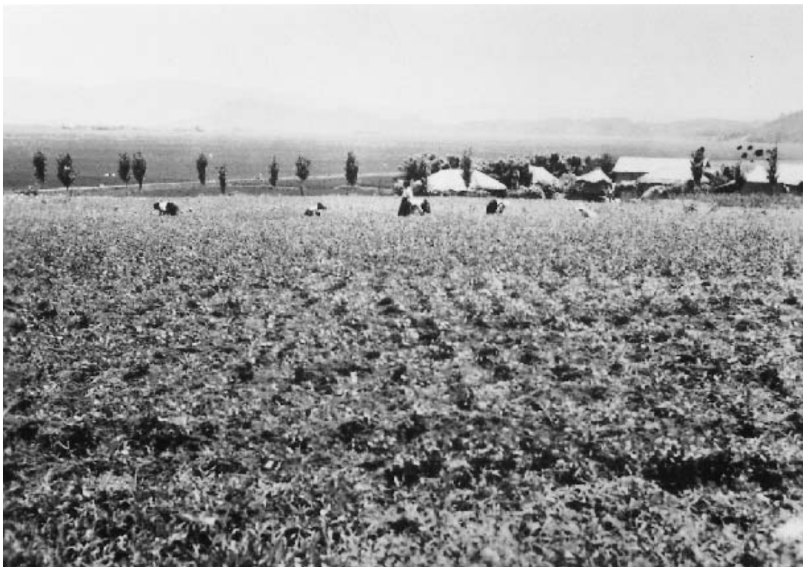
写真1 達里の大豆畑（SA3867）

当時の蔚山付近の地形や土地利用については、戦前の1914（大正3）年に陸地測量部が測量した1:50,000地形図「蔚山」（図1）から知ることができる。渋沢らが蔚山を訪れる20年ほど前に作成されたものであるが、恐らくこの間の景観はそう大きくは変わっていないものと思われる。図1の地形図を見ると、中央部を蔚山湾に注ぐ太和江（テーファーカン）が流れ、その両岸に沖積低地が開け、水田となっている様子が分かる。「達里」は三角矢印位置の集落「達洞（タルドン）」であり、水田中の微耕地に立地している様子が窺える。太和江の北側に「蔚山」の古くからの市街地があり、蔚山の北西方向には城壁で囲まれた「兵営（ピョンヨン）」の集落が見える。蔚山の旧市街地には、現在も