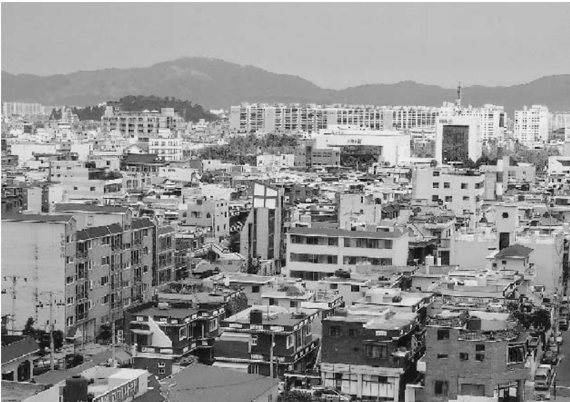
写真21 達洞から北東方向（2005. 8. 17筆者撮影）