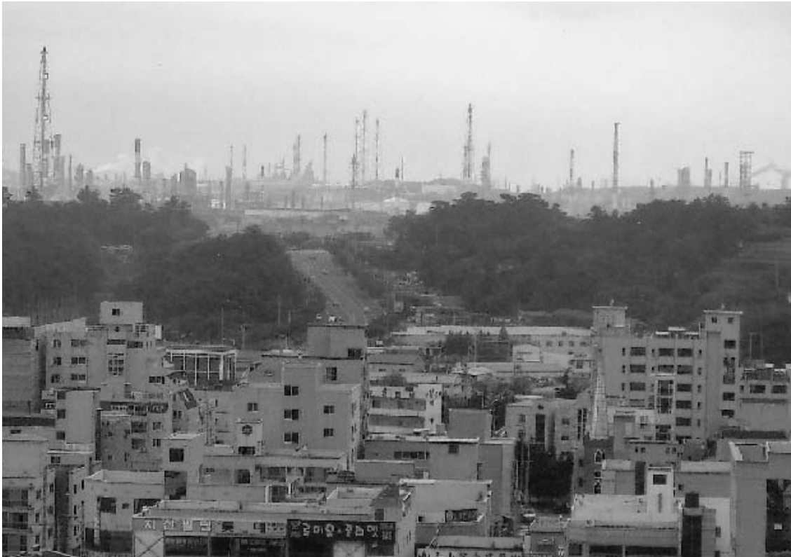
写真4 蔚山湾の石油化学工業団地 (2005. 8.18筆者撮影)