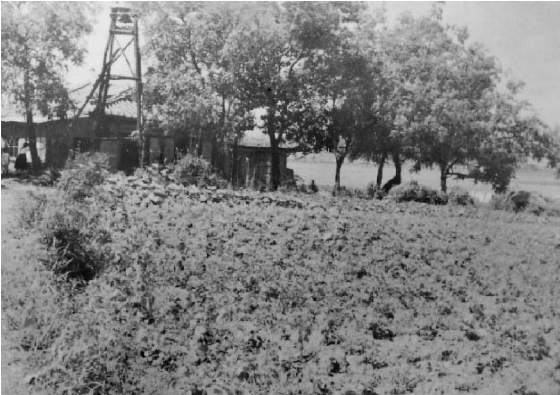
写真18 達里の広場から北方向（日本常民文化研究所所蔵：SA3885）