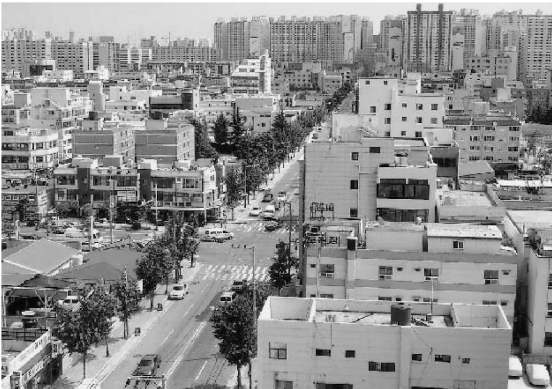
写真5 現在の達里交差点付近 (2005. 8.17筆者撮影)