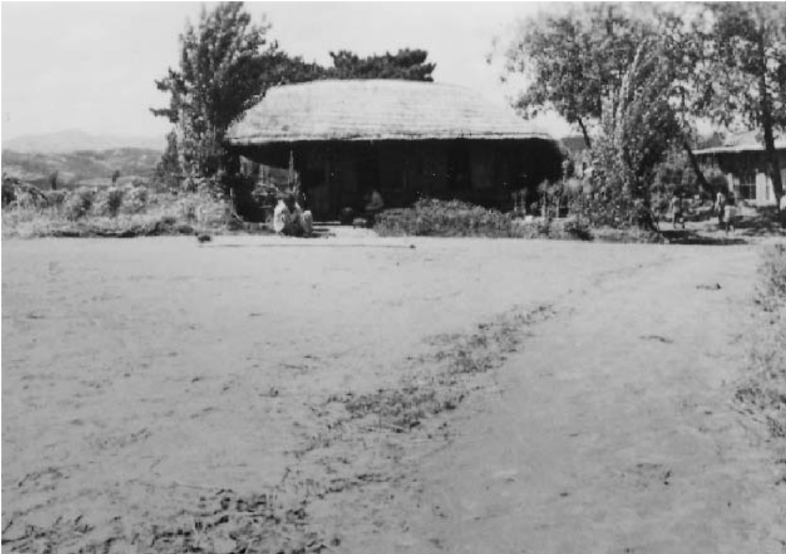
写真16 達里の広場から北西方向（日本常民文化研究所蔵：SA3885）