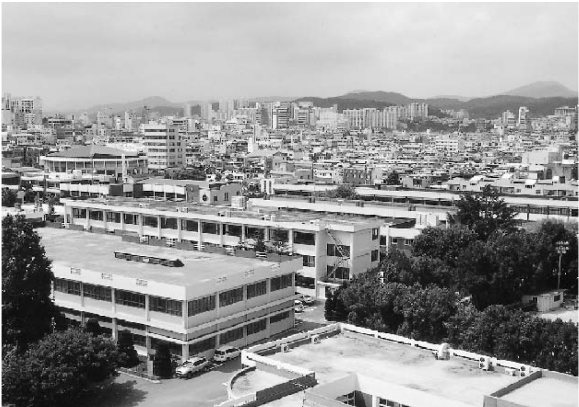
写真15 達洞から西方向（2005. 8. 17筆者撮影）