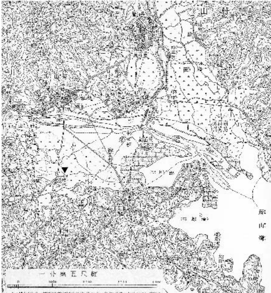
図1 1914（大正3）年陸地測量部測量1:50,000地形図「蔚山」（部分）

低層の小さな商店が立ち並び、露店も散見される（写真2）。また、兵営には今でも、城壁が歴史遺産として保護・保存され、目にすることができる（写真3）。