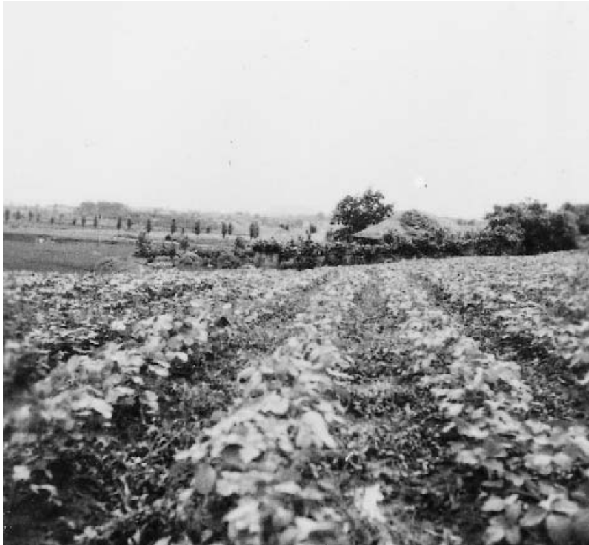
写真8 蔚山農業学校付近の畑地