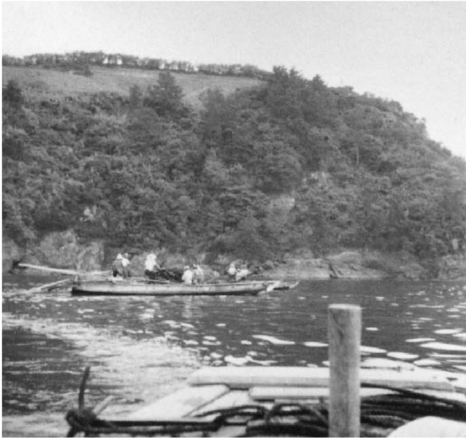
写真22 太和江とドッジル山（日本常民文化研究所蔵：SA2136）