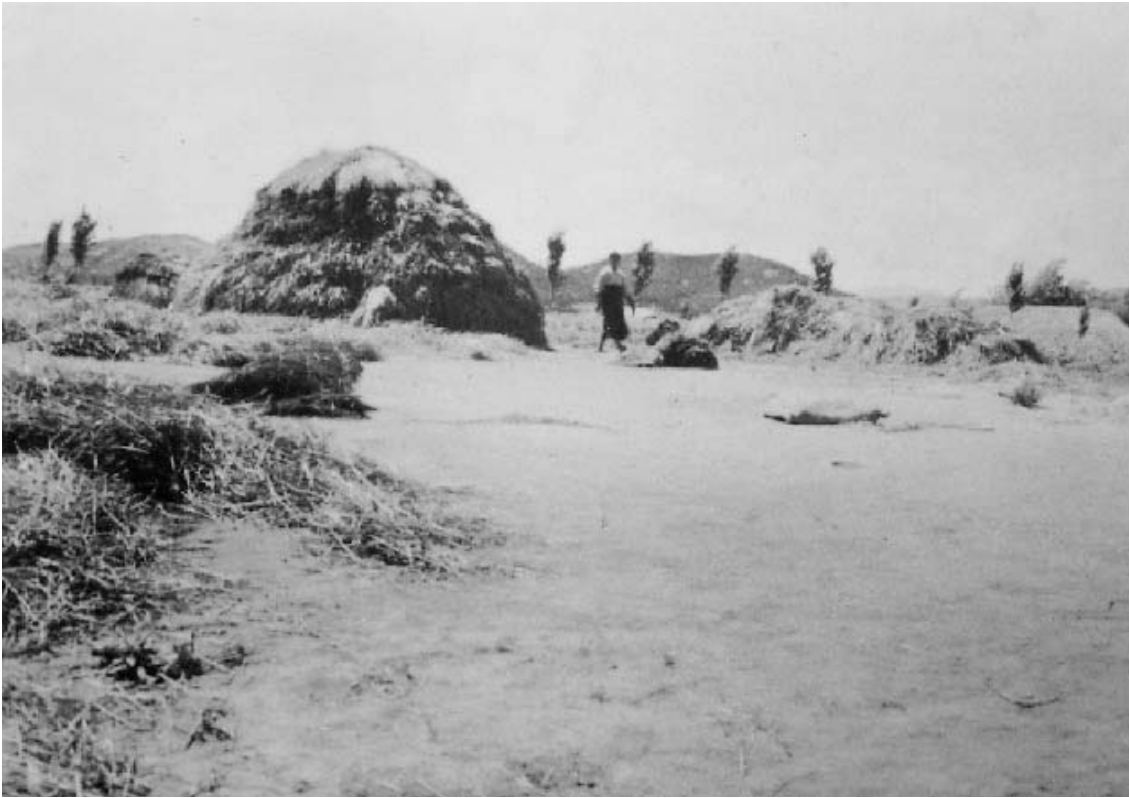
写真12 達里の広場から西南方向