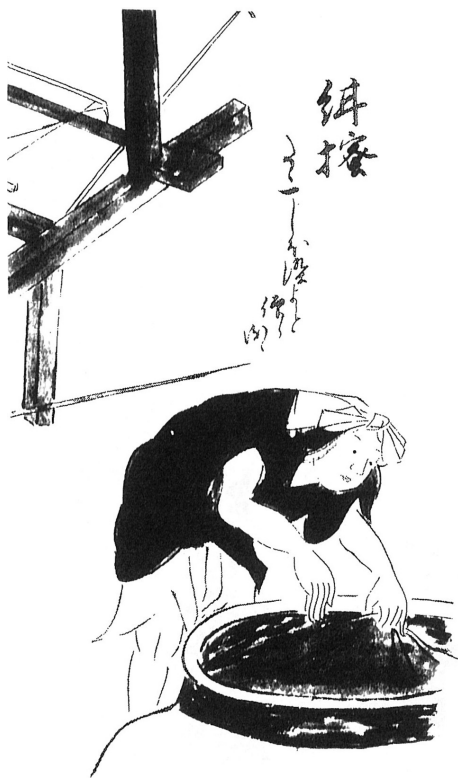
図10 「紺搔」『七十一番歌合』(『日本庶民生活史料集成 第30巻 諸職風俗図絵』)

甕のみであることに変化はない。ところが独特な筆致と視線で諸職を切り取った岩佐又兵衛の『職人尽図巻』(図11)では様子が違う。ここでの甕は二つが土間に埋められており、女性が長い棒を持って白い布を入れている。『狂詠犬百人一首』(図12)では、土間に三つ甕が埋められているのが見え、女性二人が作業中である。そして「百工図」「紺屋職」(図13)では三人の男性が働いており、土間は人物の影になって確認しにくい、そこには複数の甕が埋められているように