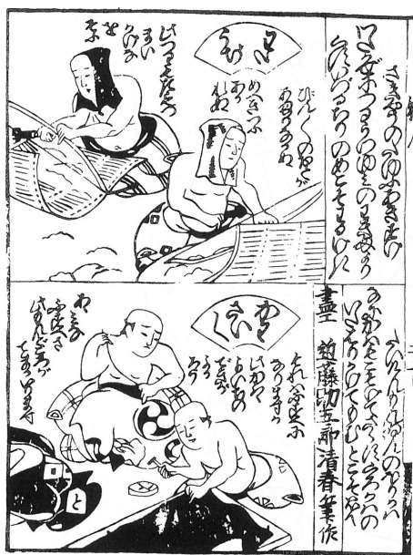
図6 「わたうち」『今様職人尽百人一首』(『日本庶民生活史料集成 第30巻 諸職風俗図絵』)