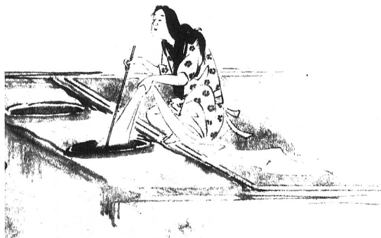
図11 「紺搔」『職人尽図巻』(『日本庶民生活史料集成 第30巻 諸職風俗図絵』)

甕のみであることに変化はない。ところが独特な筆致と視線で諸職を切り取った岩佐又兵衛の『職人尽図巻』(図11)では様子が違う。ここでの甕は二つが土間に埋められており、女性が長い棒を持って白い布を入れている。『狂詠犬百人一首』(図12)では、土間に三つ甕が埋められているのが見え、女性二人が作業中である。そして「百工図」「紺屋職」(図13)では三人の男性が働いており、土間は人物の影になって確認しにくい、そこには複数の甕が埋められているように