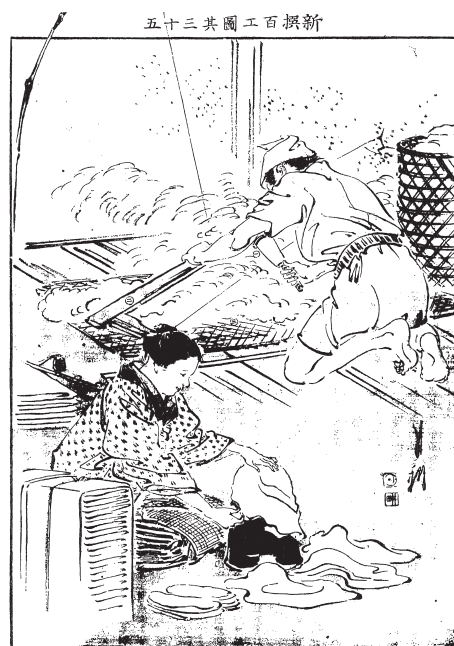
図8 「新撰百工図其35 綿打職」(『風俗画報』CD-ROM版 Ver. 2)

かむりの人が右手の槌で綿を打っている。それが「百工図」 「綿打職」(図8)になると、その巨大な弓を弦で釣ったような道具に変化している。蓮池畔人の解説によれば、この道具は檜を材料とする「綿弓」という道具であり、鯨の筋で作った弦を張り、正面に竹を立ててその竹から弓を釣って左手に弓を握り、右手には槌を握って弦を弾き、弓を高低させて綿を打つという。綿打は繊維が鼻腔に入ると身体に害があり、覆面をするようにとも書かれている。