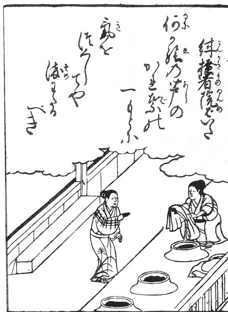
図12 「紺搔」『狂詠犬百人一首』(『日本庶民生活史料集成 第30巻 諸職風俗図絵』)