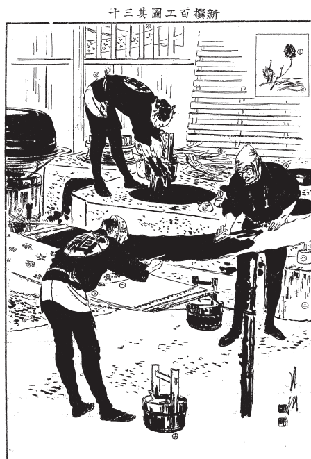
図13 「新撰百工図共30 紺屋職」(『風俗画報』CD-ROM版 Ver.2)