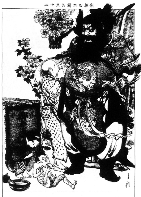
図3「新撰百工図其52 花車屋」(『風俗画報』CD-ROM版 Ver. 2)

見習修行中の少年達の図像は18点あり、髻師(41号)、蠟燭職(45号)、紙漉職(46号)、面打職(51号)、翠簾職(52号)、石工職(57号)、琴三味線師(58号)、陶器焼付職(66号)、弓職(73号)、櫛職(79号)、傘屋職(99号)、車職(106号)、碁将棋盤職(110号)、徳利印付職(116号)、鞆師(130号)、花車屋(134号)、煙管屋(148号)、芝居道具方(172号)である。これらの図像からは、一人前の前段階として、彼らがどのような作業をまかされていたのかがよくわかる。前掲、紙漉職では、画面下手で少年が粘液ネリの根を叩いて粉末にしている。陶器焼付職では、少年の一人が焼きあがった金を米のモミガラで磨いており、もう一人の少年は屋外で、絵の具を施した瀬戸を針金で結び、外窯の中へ入れようとしている。対する親方は、屋内で最も技術の必要な絵付けを行っている。徳利印付職では、桶の水に徳利を入れ、彫り付けた徳利に強く息を吹き込んで、水漏れがないか調べている少年の姿がある(図2)。花車屋では、祭礼に使う花車に乗せる巨大な鍾馗の作り物に親方が手を入れている一方、弟子の少年は鍾馗の足元にしゃがみこみ、退治される子鬼に胡粉を塗っている(図3)。