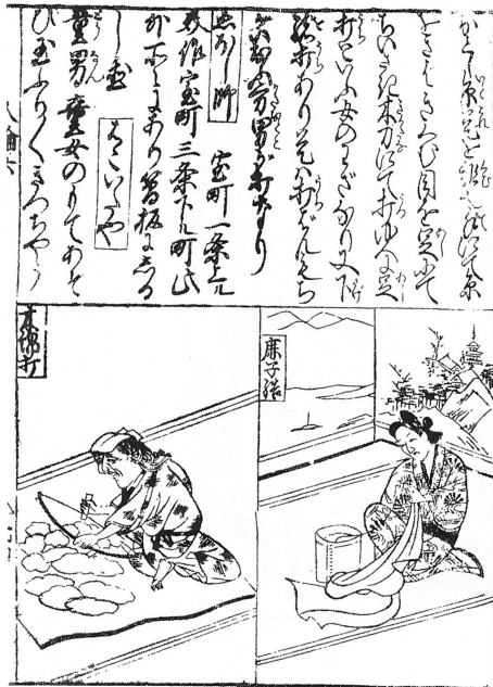
図5 「木綿打」『人倫訓蒙図象』(『日本庶民生活史料集成 第30巻 諸職風俗図絵』)