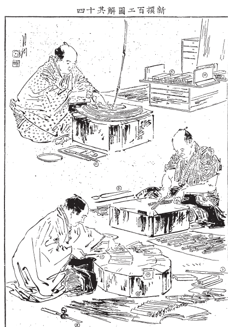
図 15 「新撰百工図共 14 扇子職」（『風俗画報』CD-ROM 版 Ver. 2）