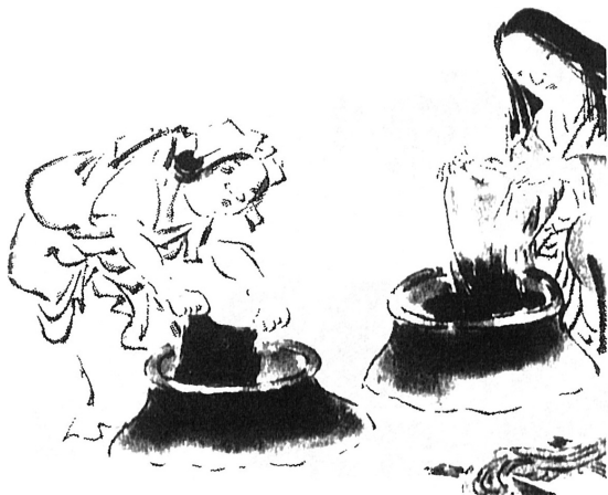
図9 「紺搔」『建保歌合』(『日本庶民生活史料集成 第30巻 諸職風俗図絵』)