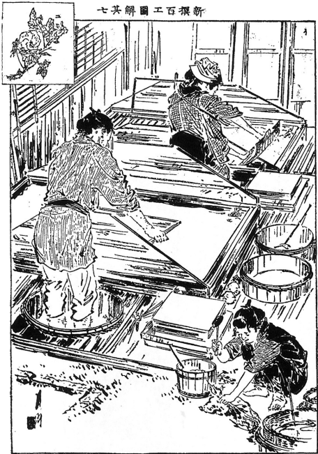
図 1 「新撰百工図其 7 紙漉職」（『風俗画報』CD-ROM 版 Ver. 2）

女性が働いている図像は 14 点ある。挑燈職（43 号）、紙漉職（46 号）、水引職（49 号）、博多織職（55 号）、抹香職（56 号）、燈心職（62 号）、縫物職（77 号）、綿打（95 号）、団扇職（114 号）、押絵師（132 号）、紅製造職（150 号）、油絞（166 号）、組糸師（182 号）、線香花火（206 号）である。そのうち二点を示すと、紙漉職では、漉槽の中に入れた杵漉簀を漉上げ、男性と同じ作業をしている女性が見える (5) （図 1）。団扇職では、二人の男性職人に混じって女性が刷毛で団扇の地紙を貼る作業をしている。