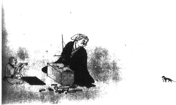
図16 「数珠引」『職人尽図巻』(『日本庶民生活史料集成 第30巻 諸職風俗図絵』)

槌や小刀が置いてある。弟子は数珠を繫いでいる。『人倫訓蒙図彙』「数珠師」(図17)では、台の前に一人の職人が座り、同じ道具で数珠を作っており、他に道具は見えない。そして「百工図」「珠数職」(図18)では、老職人が、背を丸くしながら自分の仕事場でそれと同じ道具を使用しており、月耕の符号によればこれは、(イ)轆轤であることがわかる。他にも(ロ)数珠引鉋、(ハ)盤、(ニ)砥石、(ホ)木賊(磨くの使う)、(ヘ)横槌、(ト)錐、(チ)割台を使用しており、それまでの図像には描かれていなかったが、他にいくつかの道具類を使って数珠が作られていたことを教えられる。道具の変遷を知るには、職人図像群を採す一方で、それぞれの職そのものについての資史料を収集すべきと思うが、「百工図」では、このような