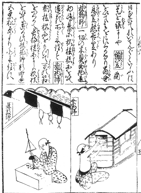
図17 「数珠師」『人倫訓蒙図彙』(『日本庶民生活史料集成 第30巻 諸職風俗図絵』)

槌や小刀が置いてある。弟子は数珠を繫いでいる。『人倫訓蒙図彙』「数珠師」(図17)では、台の前に一人の職人が座り、同じ道具で数珠を作っており、他に道具は見えない。そして「百工図」「珠数職」(図18)では、老職人が、背を丸くしながら自分の仕事場でそれと同じ道具を使用しており、月耕の符号によればこれは、(イ)轆轤であることがわかる。他にも(ロ)数珠引鉋、(ハ)盤、(ニ)砥石、(ホ)木賊(磨くの使う)、(ヘ)横槌、(ト)錐、(チ)割台を使用しており、それまでの図像には描かれていなかったが、他にいくつかの道具類を使って数珠が作られていたことを教えられる。道具の変遷を知るには、職人図像群を採す一方で、それぞれの職そのものについての資史料を収集すべきと思うが、「百工図」では、このような