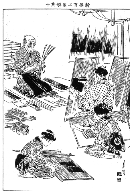
図4「新撰百工図其10 水引職」(『風俗画報』CD-ROM版 Ver. 2)

年配の職人が登場する図像は8点で、水引職(49号)、蒔絵師(53号)、鎧職(69号)、珠数職(102号)、研刀(104号)、櫛巻職(121号)、箔打(165号)、線