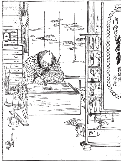
図18 「新撰百工図其38 珠数職」(『風俗画報』CD-ROM版 Ver.2)