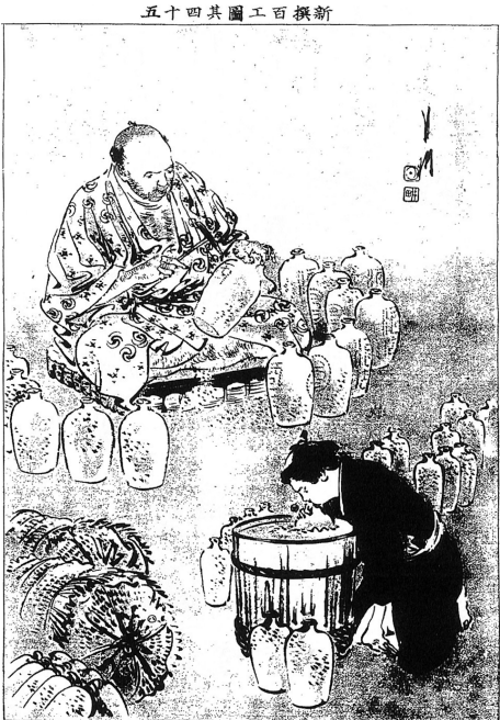
図 2 「新撰百工図其 45 徳利印付職」（『風俗画報』CD-ROM 版 Ver. 2）