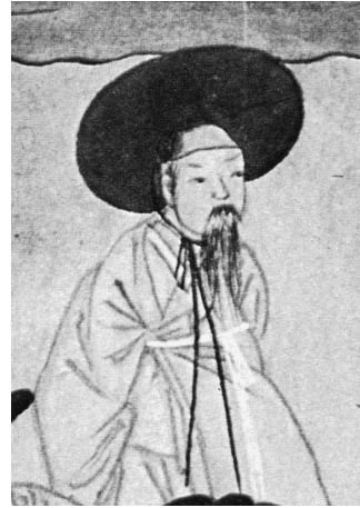
図4-2 申潤福筆『蕙園傳神帖』 「舟遊清江」部分

このように喪中には妓女を避けることが両班士大夫の道德であった。ところが、『蕙園傳神帖』の「舟遊清江」には喪中の両班が妓女と遊戯する興味深い図様が登場する（図4-1，図4-2）。