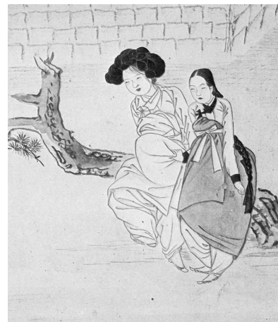
図9-2 申潤福筆『蕙園傳神帖』「嫠婦貪春」部分