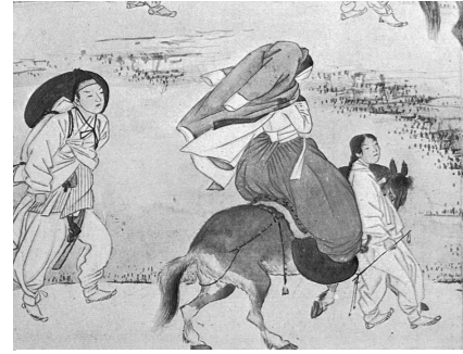
図 3-2 申潤福筆『蕙園傳神帖』「年少踏青」部分