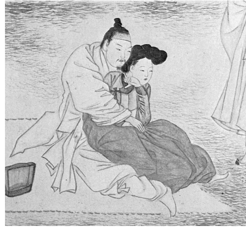
図 5-2 申潤福筆『蕙園傳神帖』「聴琴賞蓮」部分