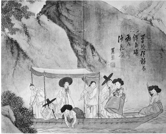
図4-1 申潤福筆『蕙園傳神帖』「舟遊清江」（潤松美術館蔵）