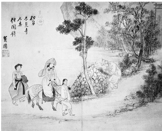
図8-1 申潤福筆『蕙園傳神帖』「聞鐘尋寺」（潤松美術館蔵）

しかし、このようなお寺の参拝は『李朝実録』に度々社会問題として取り上げられている。世宗27年の記録は、法律ですでに禁止したにもかかわらず密かに僧寺に出入りする婦女子がいることについて