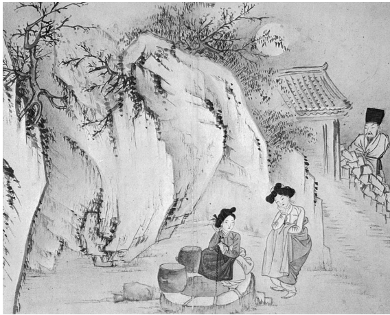
図 6 申潤福筆『蕙園傳神帖』「井辺夜話」(潤松美術館蔵)