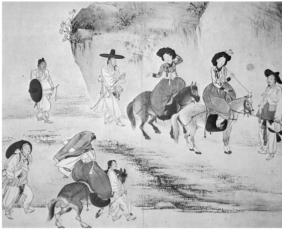
図 3-1 申潤福筆『蕙園傳神帖』「年少踏青」（澗松美術館蔵）