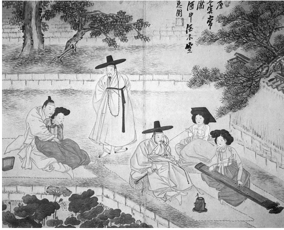
図 5-1 申潤福筆『蕙園傳神帖』「聴琴賞蓮」(潤松美術館蔵)