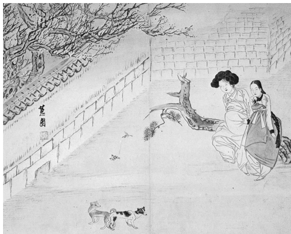
図9-1 申潤福筆『蕙園傳神帖』「嫠婦貪春」(潤松美術館蔵)

このような背景を考えれば、性を抑圧された両班家の寡婦が交尾する動物を眺めながら微笑む図様を、両班階層が楽しむために制作したとは、どうしても理解に苦しむ。貞淑であるはずの両班の女性