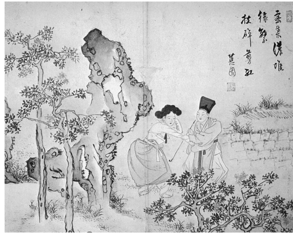
図 7 申潤福筆『蕙園傳神帖』「少年剪紅」(潤松美術館蔵)

図は私的な遊びに官妓と興ずる両班官僚を表わすものと読み取れる。『朝鮮解語花史』には、官僚が官妓と私通するのは禁じられているにもかかわらず、実際には官妓を私物のように取り扱った例が数多く取り上げられていることから、官妓を私用する両班は珍しくなかったらしい。画家は、妓女を膝の上のせて露骨に戯れる両班の図様を風刺の目で描いているようである。