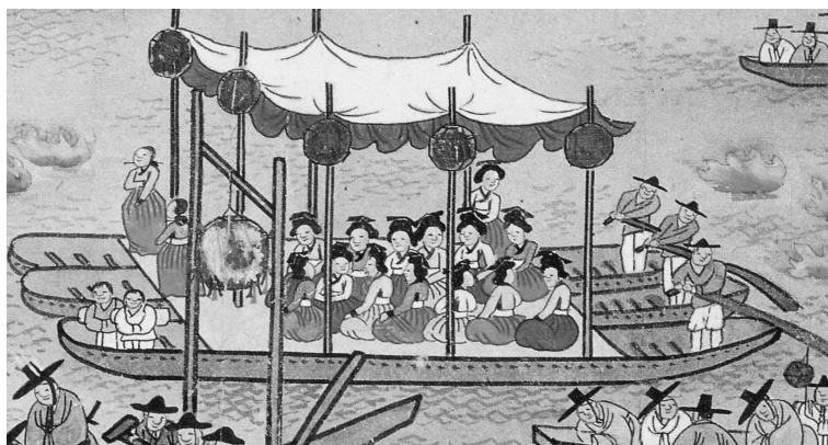
図1-2 伝金弘道筆『平壤監司饗宴図』「月夜船遊図」部分(中央博物館蔵)