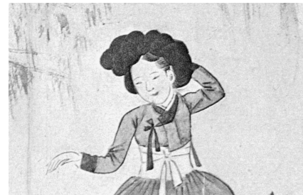
図 3-3 申潤福筆『蕙園傳神帖』「年少踏青」部分

18世紀半ば頃からとされる（図3-3）。チョゴリの袖は細く、丈は以前に比べると半分以上に短くなり、肌がみえるほどであったという。その分、下半身のチマが強調され、チマはより長く、よりふっくらと膨らむ。儒学者李徳懋（1741-1793）はその女性の服装に関して次のように記している。