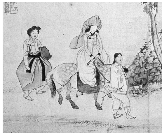
図8-2 申潤福筆『蕙園傳神帖』「聞鐘尋寺」部分