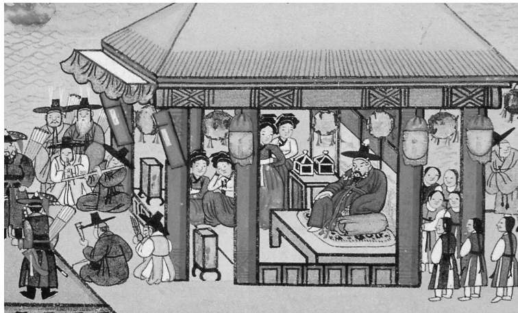
図1-1 伝金弘道筆『平壤監司饗宴図』「月夜船遊図」部分(中央博物館蔵)

厳格な身分制度を維持した朝鮮時代には、妓女の身分と処遇についても厳しく明文化されていた。朝鮮時代の妓女は基本的に国に所属していた官妓であったが、その種類は細かく細分化されていた。柳得恭(1749-?)による『京都雜記』は官妓について次のように記述する。