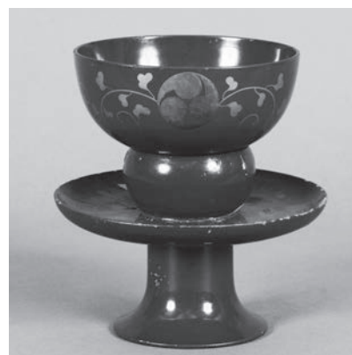
① 千歳・天目台(附属 DVD 所収 5-1・2)