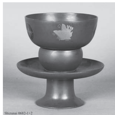
③ 静内・天目台(附属 DVD 所収 4-1・2)