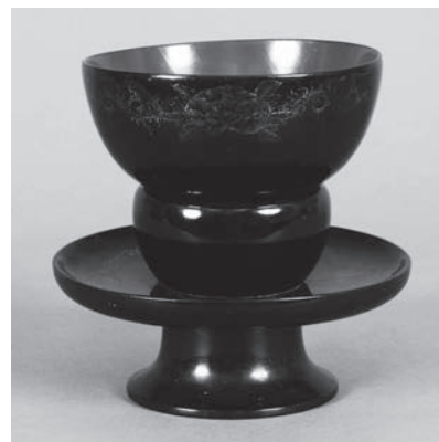
② 千歳・天目台(附属 DVD 所収 5-1・2)