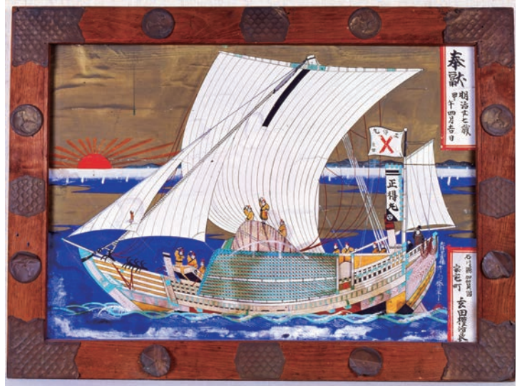
写真 2 船絵馬（青森県鯉ヶ沢町白八幡宮）洋式帆装の併用

みちのく丸は、海上において自力帆走することを目的に建造されたもので、船体構造は一部を除いて忠実な復元であるが、帆走に耐えられるよう船材の接合方法等に現代の技術が用いられた。船型は北前型の弁才船を模しており、舷側の垣立など船体艤装は江戸時代末期から明治時代初期の様式を用いている。帆柱の長さは根本から 28 m でこれに上げる帆の大きさは幅 18 m、長さ 22 m で 24 枚（反）で構成されている。材質は本来は木綿であるが、強度と乾燥を考慮して合成繊維を木綿風に染めたものを使用している。みちのく丸は 2006 年 5 月に青森県の陸奥湾内で初めての帆走に成功、同年 10 月 1 日には、風上に向かって進む「マギリ走り」の試みにも成功した。帆走方法については、大阪の浪華丸が実施した帆走実験の成果（や）、文献資料、船絵馬や古写真を参考にして試行錯誤の上、実施したものである。特に風上に進む「マギリ」帆走は、帆桁の両端に取り付けた手縄を調節して、帆桁を風の方向に斜めに配置し、風上側の帆の端に取り付けた両方綱を船首方向から引いて帆が風をはらむようにし、帆の下から出ている綱（帆足）の取り付け位置を斜めに変更し、風が入りやすいよう調整した。古写真に記録されたマギリ帆走とみちのく丸のマギリ帆走はほぼ相似の帆走状態として記録さ