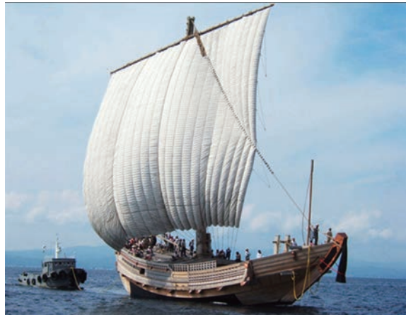
写真5 マグリ航行のみちのく丸