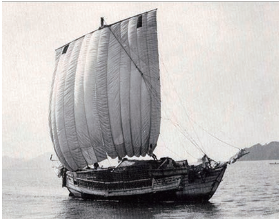
写真4 マグリ航行で小浜港に入港する北前船