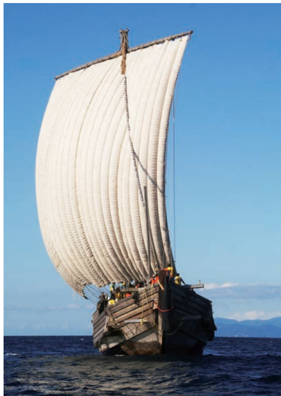
写真 3 みちのく丸