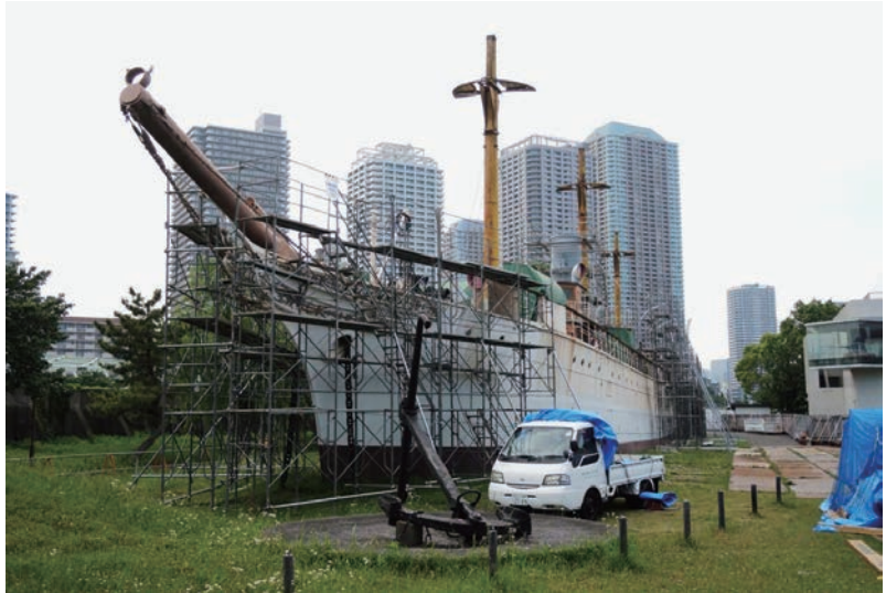
写真7 修復工事中の重要文化財「明治丸」東京海洋大学蔵

当日は、船という一般にはなじみの薄いテーマにもかかわらず、首都圏をはじめ岐阜県、富山県、青森県などから100名を超える参加者があり、一般参加者も80名を超えた。企画展も好評で今後も船に関する資料の充実と情報の発信への期待が感じられた。