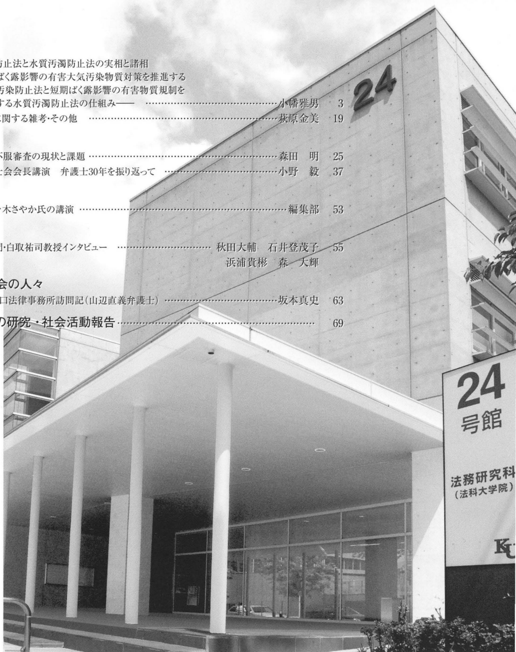
神奈川大学 大学院 法務研究科