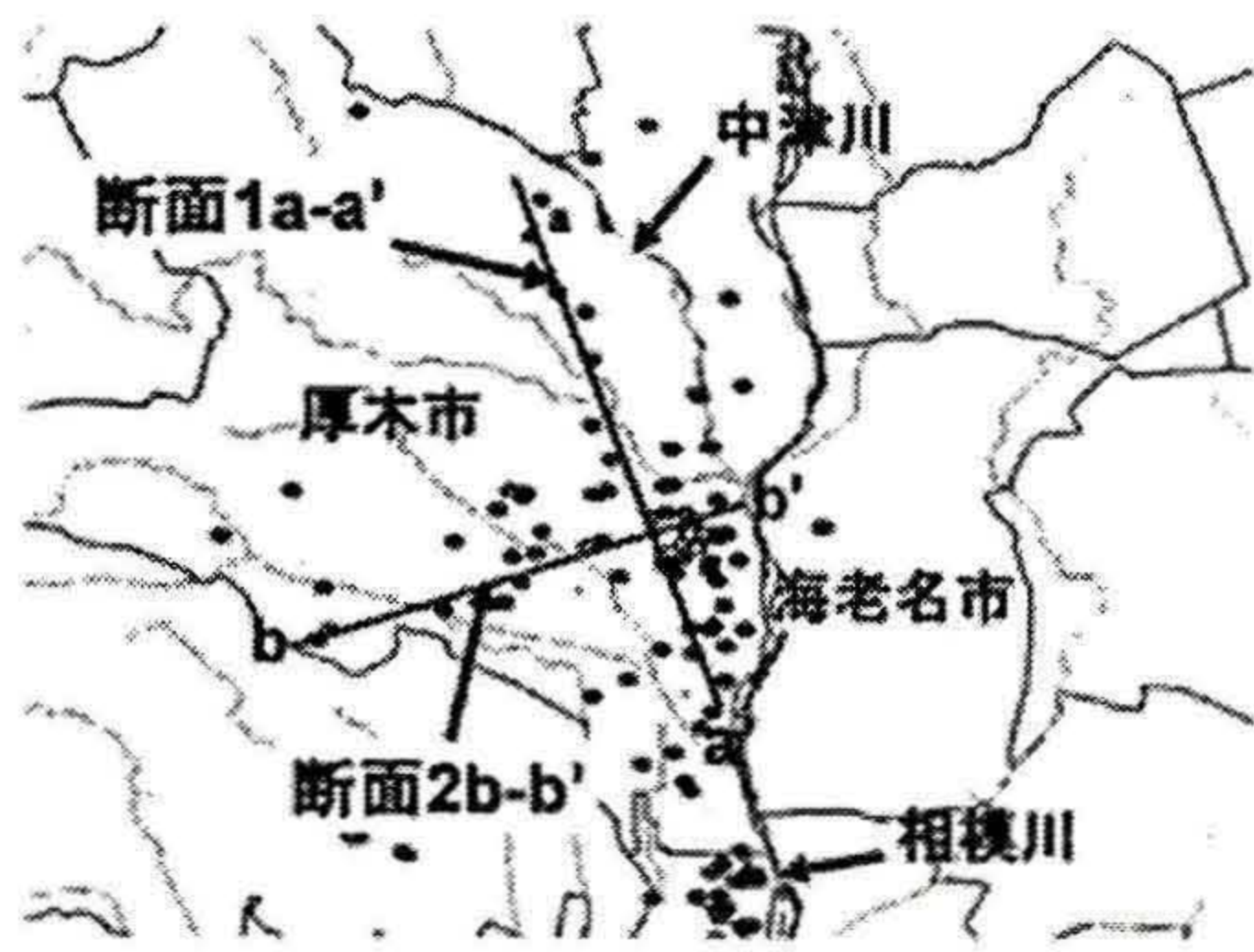
図2 足柄平野北部断面線