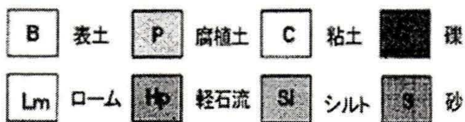
図3 断面図、地質凡例