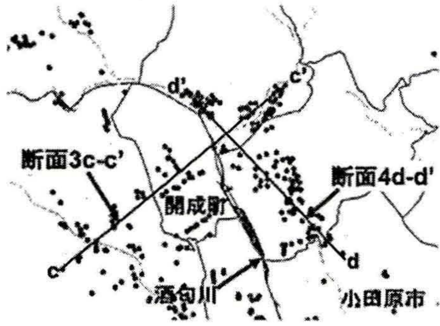
図1 足柄平野北西部断

【参考文献】1) 国土地理院: 数値地図 50mメッシュ(標高)日本-III 世界測地系対応(2000.6). 2) 大森昌衛・端山好和・堀口万吉: 日本の地質「関東地方」編集委員会編(1986.10) 3) 荏本孝久他: IT技術を活用した地盤管理のシステム化と活用技術に関する研究、神奈川県立大学工学研究所所報第27号, 2004.