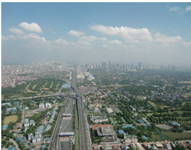
【マニラ上空より】中央の高速道路左手奥がマニラ市。右手は高層ビルが群立するビジネス街マカティ市。