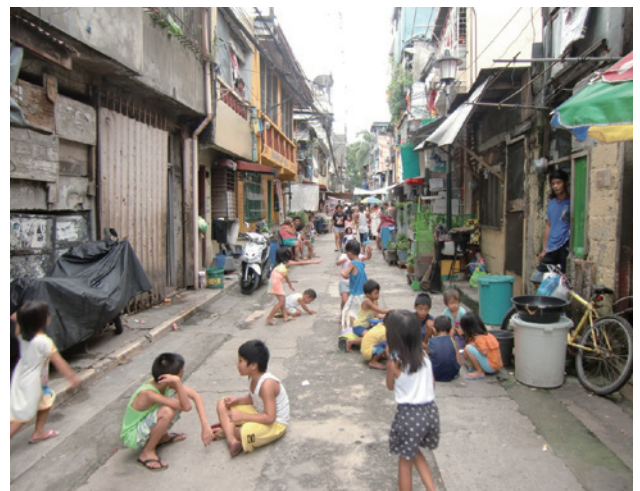
【マニラ市内の一風景】インフォーマル経済を構成する貧困層の多くが生活するスクワッター地区。