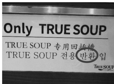
図2 반환 (羽田空港・2019)