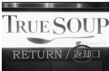
図1 返却 (羽田空港・2019)