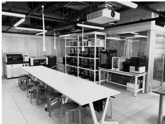
写真3 ファブラボみなとみらい

ルカッター、3D プリンター、各種ハンドツール・電子工作ツールなどがある (FabLab JapanNetwork “What’s FabLab?”. FabLab Japan. http://fablabjapan.org/whatsfablab/ (閲覧日：2021 年 8 月 30 日))。