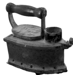
写真4 アイロンを 3D スキャンしたデジタル画像

2022 年度、日本常民文化研究所は博物館相当施設の許諾申請を行う。また、国際日本学部歴史民俗学科の学生たちのなかにも、デジタルファブリケーションへの関心が芽生えてきている。歴史民俗資料とデジタルファブリケーションの可能性の研究は、これからますます重要性を増していくものと思われる。