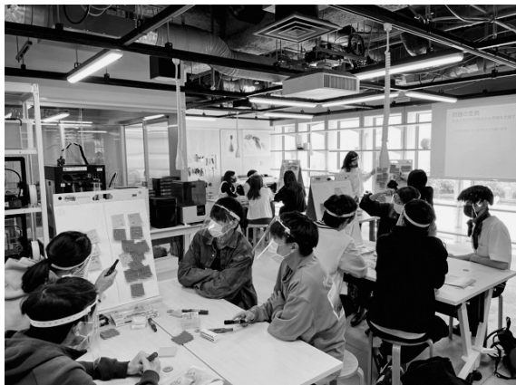
写真2 ファブラボみなとみらいの作業風景 (2021 年度)