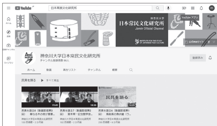
写真3 公式 YouTube チャンネル https://www.youtube.com/channel/UCbYukzC1LpryLpOiHnn07mg/

新型コロナウイルス（COVID-19）の影響が続く中で、インターネットを活用した情報発信はより重要性を増している。従来から行ってきた Web サイトによる情報発信と、今年度開始した SNS（Facebook、Twitter）および動画配信（YouTube）の、それぞれの長所を組み合わせ、本研究所の研究活動をより広く知ってもらえるよう、今後も検討を重ねていきたいと考えている。