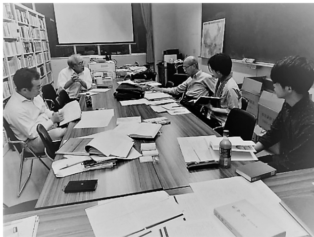
図3 読み合わせ会の様子

会において話題となったこと、そして私が個人的に興味をもったことなどを略述して記録としたい。なお、今回は1930年までの記録である。