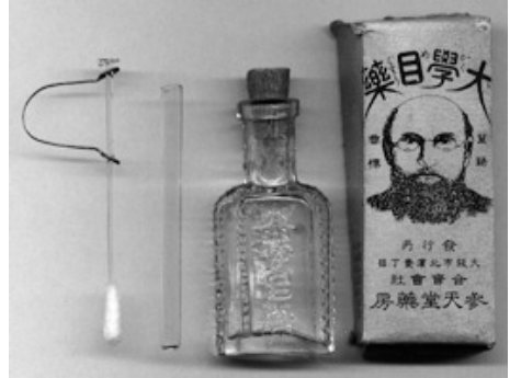
図4 『大学目薬』のパッケージ、容器、ガラス管（北多摩薬剤師会ホームページより）

1921年、早稲田大学の内ヶ崎作三郎を各地に案内し、その講演を準備した。講演は極めて好評であった。『花甲録』には、この年、谷崎潤一郎を郭沫若、田漢、郁達夫ら中国の作家に合わせたとあるが、読み合わせ会では、その時期はもっと後の1926年ではないか、と議論になった。年代については注意が必要であるというのは上述のとおりである。