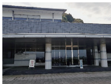
写真4 大津市歴史博物館