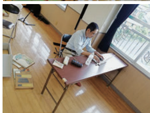
写真1、2、3 人形劇の図書館所蔵紙芝居の調査風景

争と」というタイトルで 奈川大学非文字資料研究センター2019年度第2回公開研究会『戦時下紙芝居と現代人形劇の交差点』（2020年2月29日開催予定）での講演をお願いし