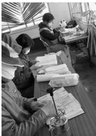
写真3 被災資料を整理する神大ボランティア