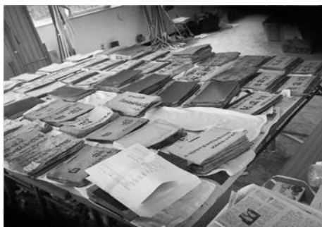
写真2 被災した旧大島漁協文庫