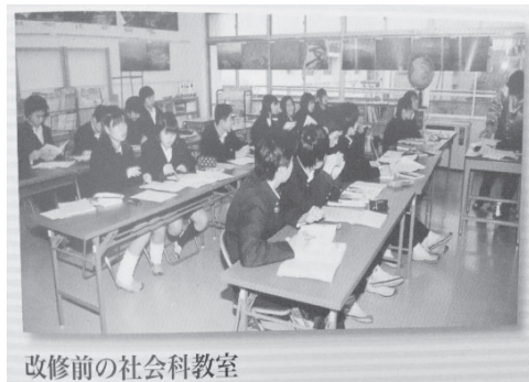
改修前の社会科教室

その中で、用務員の協力と発想・行動力は、目を見張るものがあり、感謝の言葉が尽きな