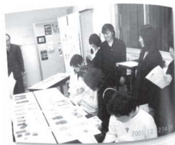
視聴覚室を英語教室へ改修。教室の色はピンク。赤色系は、活動的な作用を起こすとのこと。会話などのアクティブな授業に向いている。