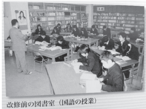
改修前の図書室（国語の授業）