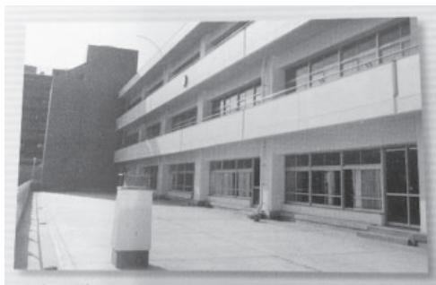
教室とつながっているベランダ。魅力的な場所でありながら、生徒には出ることを禁止していた。

三年生は、教室に隣接する広いベランダが格好の息抜き場であった。始業チャイムが鳴っても走り回る者、車座になり話し込む者、大の字になって寝転がる者など、思い思いの時間を過ごしていて、なかなか教室に入らない。やっと教室に入ったかと思えば15分も過ぎれば授業に飽きてしまうか、わからなくなって教室から出てきてしまう。片方のクラスから一人でもベランダに出れば、必ずもう片方クラスに影響が出る。魅力的な場所でありながらベランダ使用のルールは、出ることを禁止にしていた。指導はバラバラになり、守らせることが不可能になるだけでなく、守らせようとする教員と生徒のトラブル、指導しない教員の前では無法地帯となっていた。