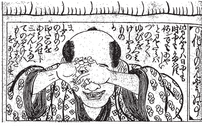
図2 狐の窓（「新板化物念代気」文政2年）

み合わせるのかは図1が参考になる。最初に①のように両手の中指と薬指を曲げて親指につけた狐頭の形をつくり、それから順に左右の指を組んでいく。特徴的なのは、手の平と甲が同時に両面にある点で、これは裏と表が同時に存在するという形で、象徴的に解釈すれば、異なる二つの世界に接しているながらそのどちらでもないという境界性を表現している。そこに開けられた中央の窓（穴）は、まさしく妖異の潜む異界を透視する隙間としての意味を帯びている。