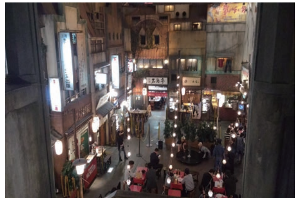
写真1 新横浜ラーメン博物館

さらに、近代史と関連した多くの史跡と博物館があり、まさに横浜は活きた歴史書であるといえます。特に、新横浜にある新横浜ラーメン博物館はとても魅力的でした。私はこのごく普通の食べ物を特別な文化遺産にまでしてしまう日本人のアイデアに驚きました。素直に言うと、私は展示品を見るより、様々な種類のラーメンを賞味するのにより多くの時間を費やしましたが、それはラーメンの歴史を理解する上で有益な時間でした。豚カツやカステラと同様に、日本人が外国の文化を受け入れた後、自分たちのライフスタイルに沿ってそれらを変えていったという事実を考察することができました。ラーメンの歴史は日本人の歴史を把握するのに適した題材であると思います。