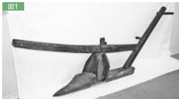
図1 葛飾の犁（葛飾区郷土と天文の博物館）

以上に見たように、民具の形には機能情報のほかにその民具がたどってきた歴史、言いかえればその地に生きてきた人々の古代以来の歴史情報がおどろくほど豊かに保存されている。ある人が葛飾の犁を「道具」と呼ぶ場