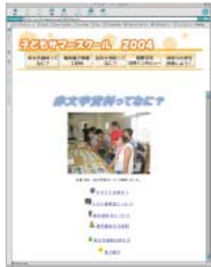
作成したホームページより