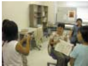
COE 研究員に業務内容について質問をする。