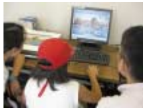
画像資料をパソコンに取り込む作業に挑戦。