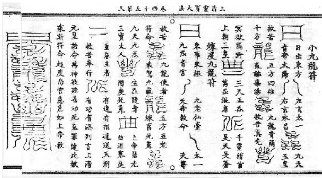
図2 王氏大法の九龍符（散形と聚形）