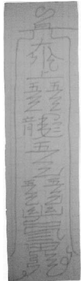
写真3 陳榮盛道長の九龍符 （功德文検からのトレース）