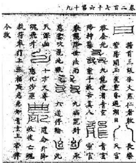
図3 林氏金書の九龍符（散形のみ）