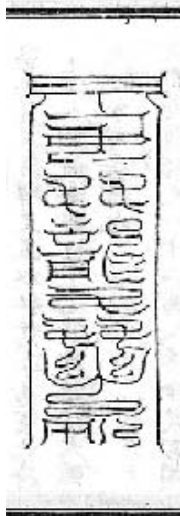
図1 金氏大法の九龍符（聚形）