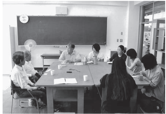
写真2 島民の方からの聞き書き調査（2016年9月）

本年度の主な事業内容は上記の通りであるが、2015年度に実施した聞き書きに関して不明な部分があったため、越智が2016年10月21日・22日に三宅島へ赴き、当時お話をしていた話者2名から教育委員会の方々も交えて、本年度刊行予定の原稿をもとに確認作業を行った。その2015年度の聞き書き調査の結果は、2017年3月に『三宅島のオーラルヒストリー』と題する冊子にまとめて公刊した。いずれも話者が語ってくれたことを基礎とするもので、「無常講」「足入れ婚」「流刑人」「喧嘩神輿」「海女」の話など、三宅島固有の大変興味深い内容となっている。