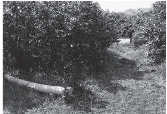
写真4 神着地区の溶岩流で埋まった神社の鳥居と社殿（2016年9月）