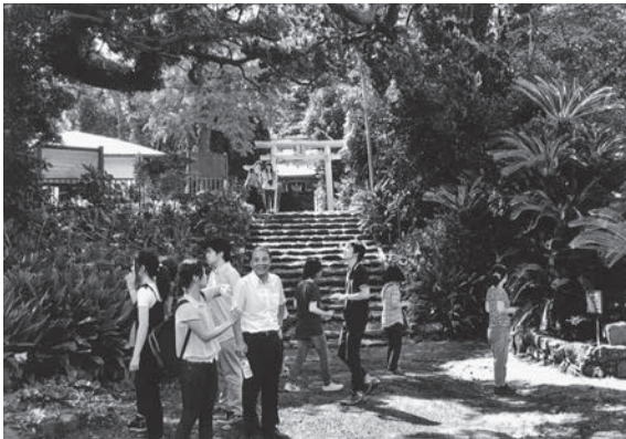
写真3 島内巡検（2016年9月）