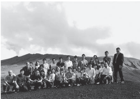
写真5 島内巡検の集合写真（2016年9月）