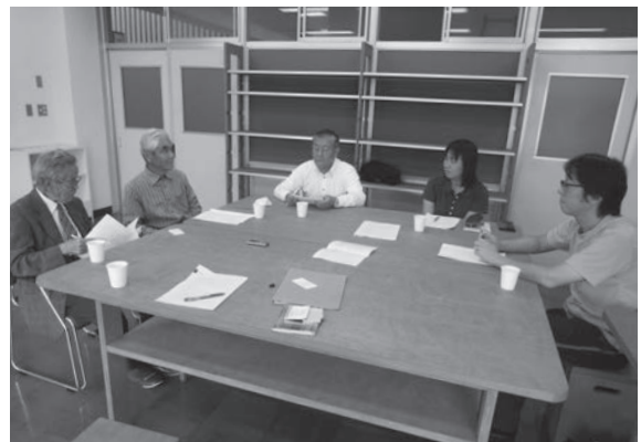
写真6 聞き書きの原稿の確認（2016年10月）