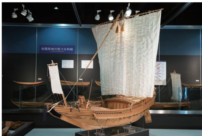
写真2 菱垣廻船模型