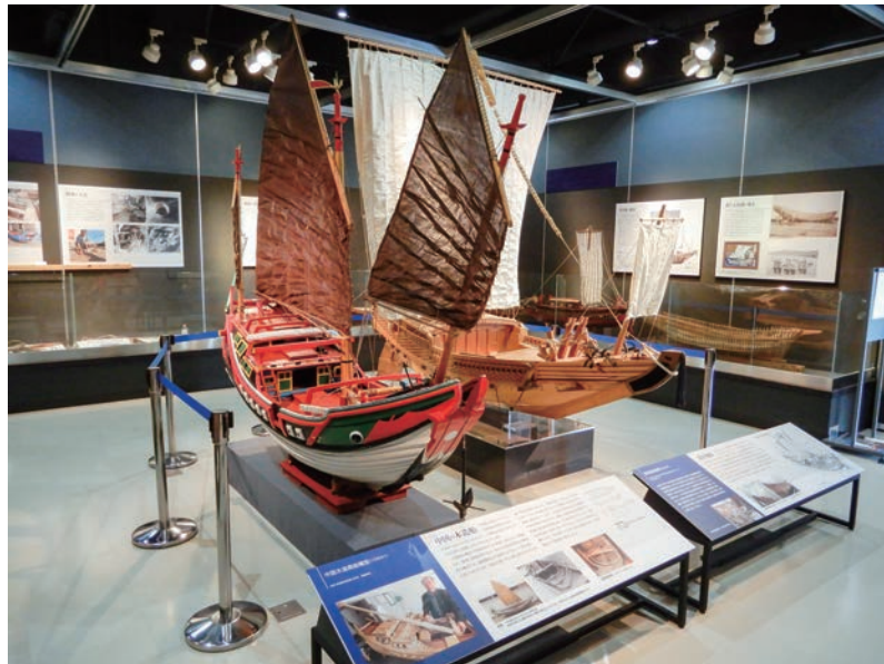
写真1 展示会場（左中国船、右菱垣廻船）