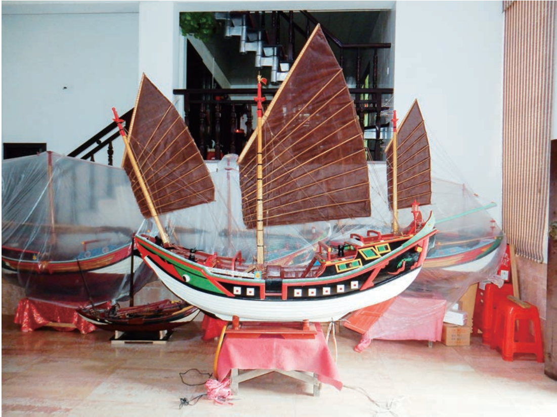
写真3 搬入前の中国船模型（中国福建省泉州市張国輝氏工房）