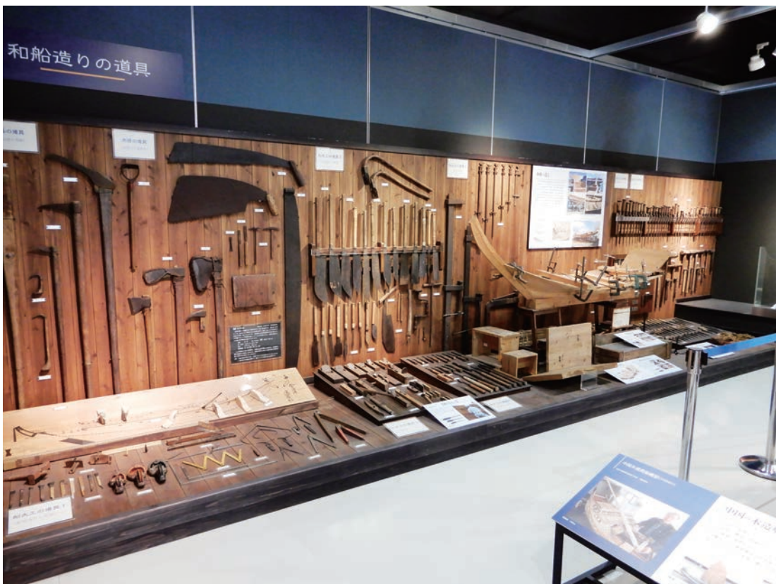
写真4 日本の船大工道具