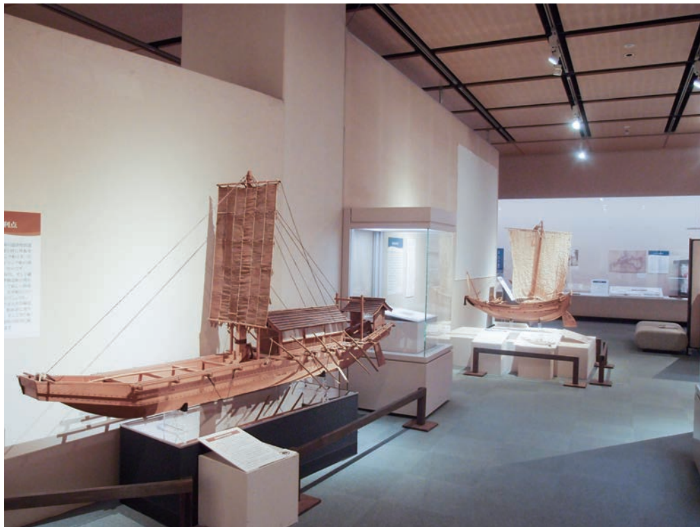
写真6 横浜市歴史博物館会場（本学貸出資料 左・鎌倉時代の廻船模型、右・菱垣廻船半割模型）