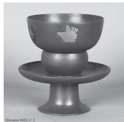
③ 静内・天目台(附属 DVD 所収 4-1・2)