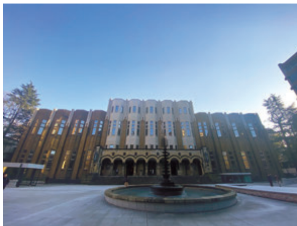
写真2 東京大学附属図書館