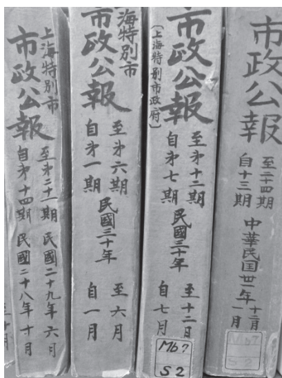
【図1】 上海市特別市政府編『市政公報』（一部）